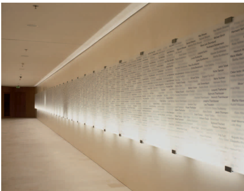
Gang mit Namen ermordeter Münchner Juden