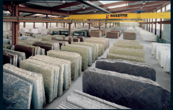
Stammsitz Holzwickede Stehfenstr. 59-61 · 59439 Holzwickede Tel. 023 01 - 9 13 32-0 · Fax 9 13 32-32