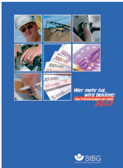
StBG-Info-Broschüre zum Prämiensystem