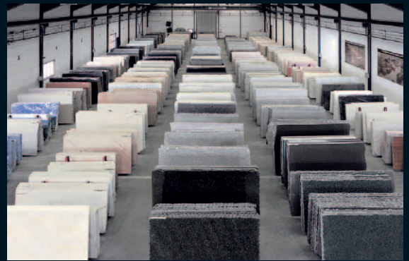
Filiale Nord Gottlieb-Daimler-Str. 27 · 28816 Stuhr/Brinkum Tel. 04 21 - 8 98 33-0 · Fax 8 98 33-22