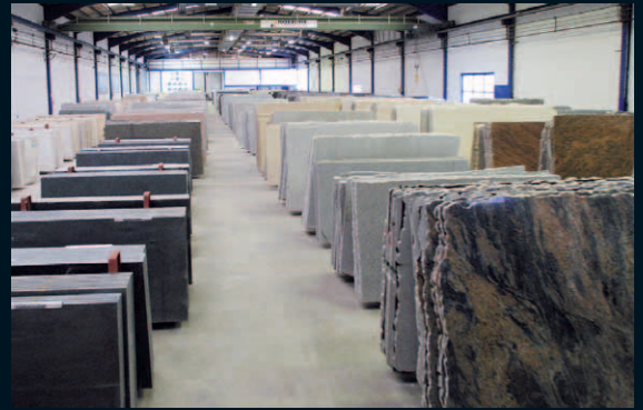
Filiale Süd Daimlerstr. 61-63 · 69190 Walldorf Tel. 0 62 27 - 3 09 92-70 · Fax 3 09 92-99