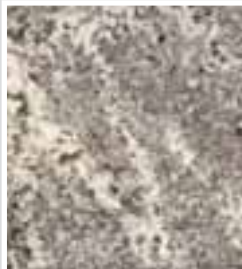
TERRANOVA, Granit, Minas Gerais