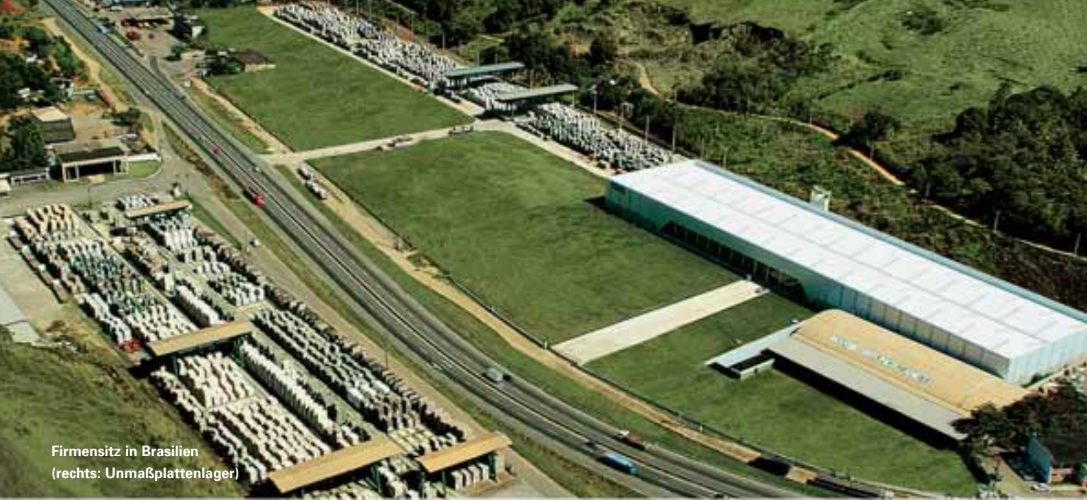
Firmensitz in Brasilien (rechts: Unmaßplattenlager)