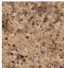
OURO BRASIL, Granit, Espirito Santo