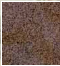
GOLDEN GATE, Granit, Bahia