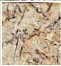
GOLDEN FLAKES, Granit, Minas Gerais