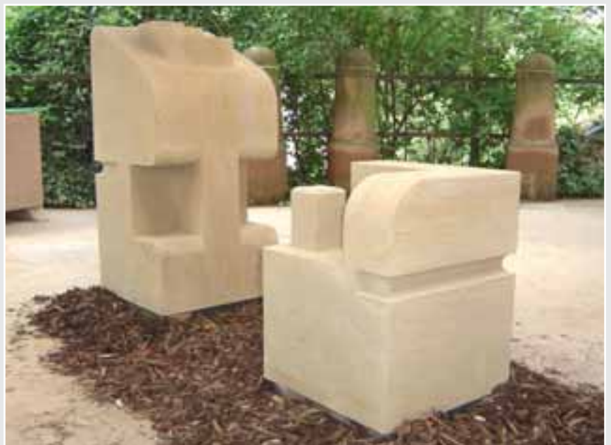
Sitzbankpfeiler von Bastian Dockendorf, FINKENBACHER SANDSTEIN