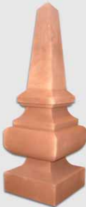
Obelisk von Tobias Uhrig, OBER- SCHLETTENBACHER SANDSTEIN