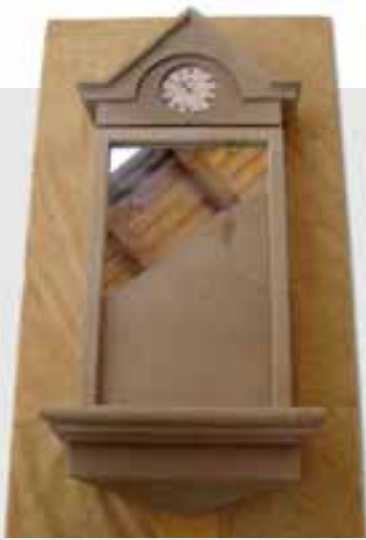
Wanduhr von Alexander Höhn, OBERSULZBACHER SANDSTEIN