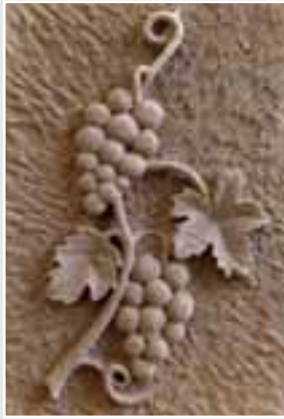
Bildhauerarbeitsprobe I von Alexander Höhn