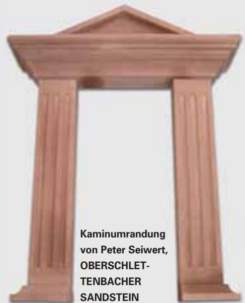
Kaminumrandung von Peter Seiwert, OBERSCHLET- TENBACHER SANDSTEIN