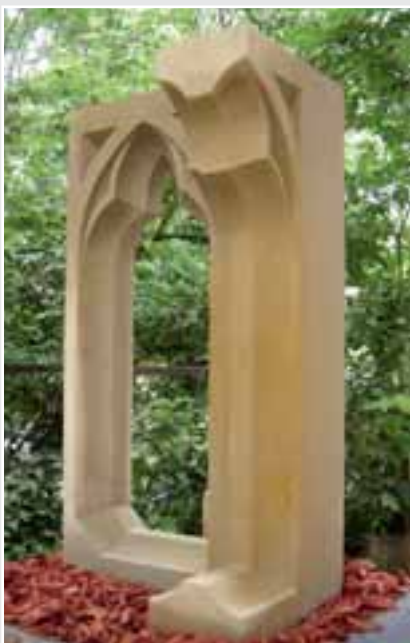
Eckmaßwerk, Balustradenstück von Patrik Engelskircher, SEEBERGER SANDSTEIN