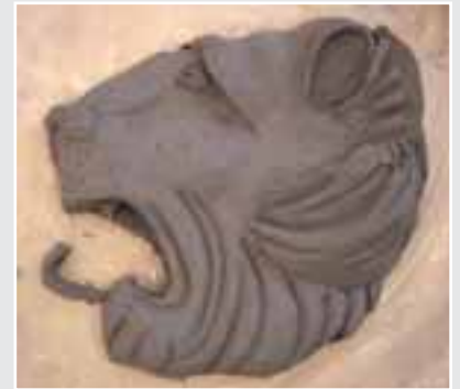
Bildhauerarbeitsprobe II von Matthias Becker