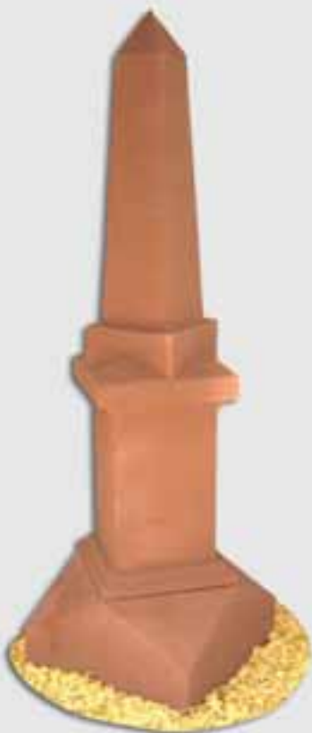
Obelisk von Matthias Becker, OBER- SCHLETTENBACHER SANDSTEIN