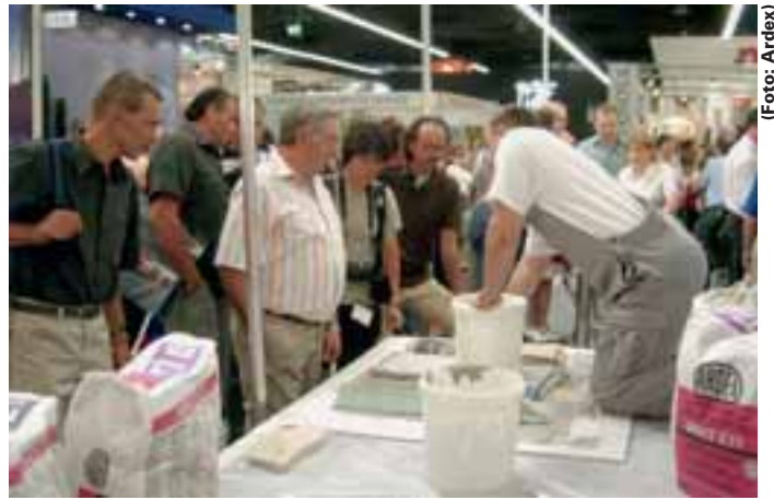
Produktvorführung am Stand der Ardex GmbH