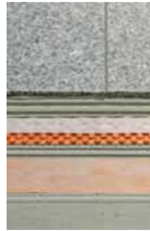
Die kapillarpassive Verbund-drainage DITRA-DRAIN