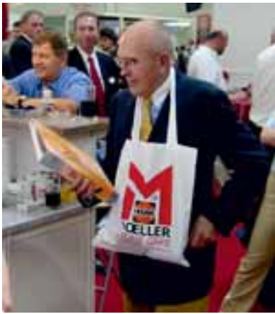
Gut informiert: am Stand von Möller-Chemie