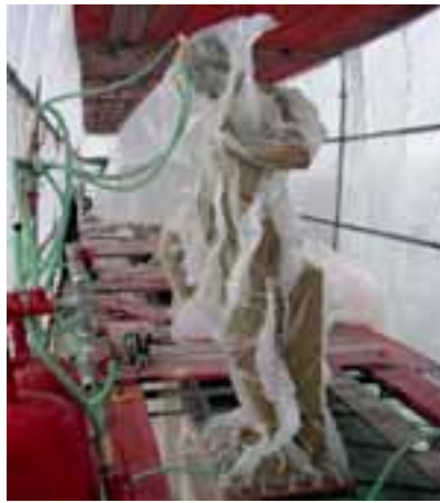
Das neue Vakuumverfahren von Remmers