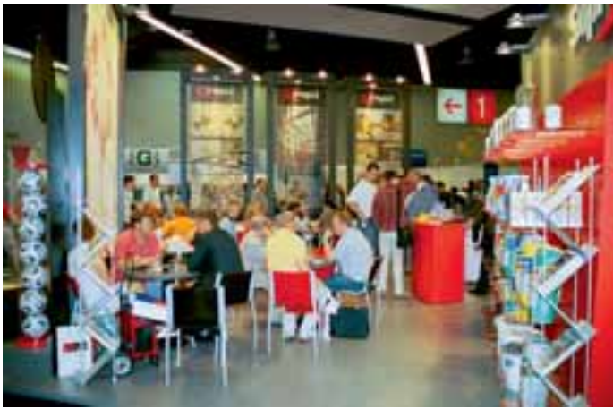
Der gut besuchte Sopro-Messestand