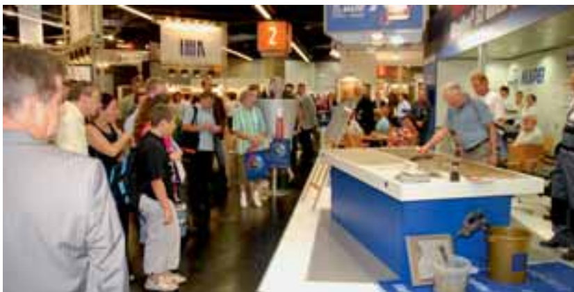
Produktvorführung am Mapei-Stand

Für die Verfugung von hoch beanspruchten Flächen im öffentlichen und gewerblichen Bereich bietet Mapei die »Mapedrain Zementfuge«. Er-