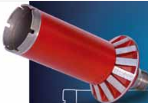
Diamant Bohrsenker 18522 Ø 70/45 Bohrtiefe 90mm Typ Granit Anschluss R1/2" Zapfen mit integrierter Wasserkühlung

Die Kasprick Diamantwerkzeuge GmbH fertigt für Sie seit über 30 Jahren präzise Diamantwerkzeuge. Immer mit höchstem Qualitätsanspruch und immer perfekt in Form - egal ob Sie bohren, fräsen, schleifen oder trennen.