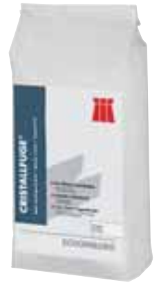
Der mineralische Feinfugenmörtel CRISTALLFUGE von SCHOMBURG

gramm des Unternehmens sind auch umweltfreundliche Lösungsmittelfreie Steinpflege-Produkte u.a. für die Bereiche Reinigung, Tiefenimprägnierung und Farbvertiefung ( www.poschacher.at ).