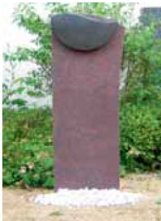
Kombination aus DALVA und IMPALA