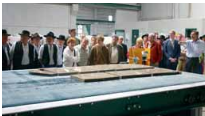
Handwerkerfrühstück bei der Firma Vetter

Vetter Naturstein GmbH Industriestraße 16 97483 Eltmann Tel.: 095 22 / 7 29 - 0 Fax: 095 22 / 7 29 - 99 zentrale@stein-vetter.de www.stein-vetter.de