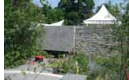
Mauer aus dem anroechter stein bei der Landpartie Schloss Bückeburg

Auf 69 m 2 boten sich den Besuchern u. a. Nutzungsoberflächen in der Leitfarbe Grün, darunter Quader mit gestrahlten Oberflächen und Mauersteine mit gebrochenen Oberflächen, die jeweils eine hohe Wand bildeten und das »grüne Zimmer« einrahmten. Außerdem wurde ein 7,5 t schwerer Wasserkamin gezeigt. Mit Boden- und Maßplatten, geschliffenen Werkstücken und Mauersteinen wur-