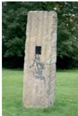
Ausstellung »Stelen Sentenzen«: Arbeit von Martin Kirstein