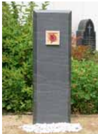
Stele mit Sandstein-Applikation