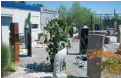
Sommerausstellung von Sievers Granit

Landstraße 51 38667 Bad Harzburg Tel.: 0 53 22/90 69-0 Fax: 0 80 00/90 69-25 info@sievers-granit.de www.sievers-granit.de