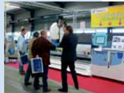
Open Days bei Thibaut

Der französische Maschinenhersteller Thibaut hat vom 18. bis 21. April Tage der offenen Tür veranstaltet. Partner aus 20 Ländern und Kunden von mehr als 60 Firmen aus über 15 Ländern nutzten die Gelegenheit, um sich auszutauschen und über Neuheiten, darunter die Maschinen T812, T858 und TC750 zu informieren. Deutscher Vertriebspartner ist die Firma J. König.