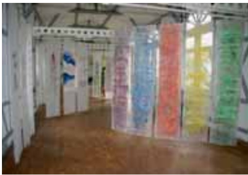
»Stelen Sentenzen«: Ergänzungsausstellung im Spielhaus des Schlossparks