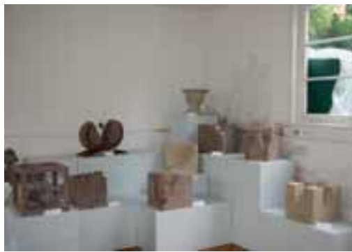
Im Rahmen des »Würfelprojekts« ausgestellte Lehrlingsarbeiten

Im Rahmen der Landestagung wurde die Ausstellung »Stelen Sentenzen« im Schlosspark Winnenden besichtigt. Seit