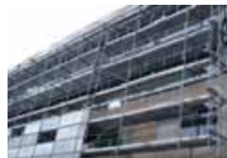
Baustelle E-ON Hauptverwaltung in München

Die Firma NAUTH SL hat im letzten Jahr u. a. die Unterkonstruktionssysteme für die Ziegelfassaden an den Neubauten der Europäischen Union sowie zwei Gymnasien in Straßburg geliefert. Maßgeblich für die Beauftragung waren Nachweise für Erdbebenbelastungen. Weitere Referenzen sind die E-ON Hauptverwaltung in München mit Jura-Platten mit einem Gewicht bis 170 kg und eine Augenklinik in Teheran. Aktuelle Projekte sind u. a. der Londoner Flughafen Heathrow, ein Büroensemble mit Glaselementen am Auswärtigen Amt in Berlin