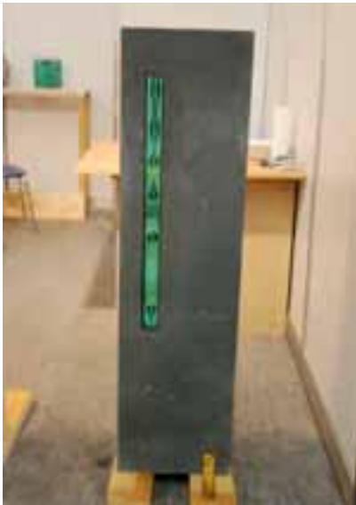
Tomas Cechura hat interessante Glaselemente für die Grabmalgestaltung entwickelt (▷ S. 49).