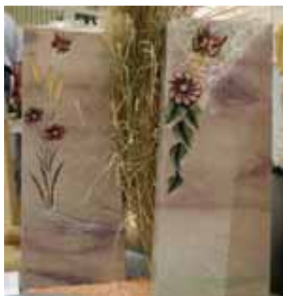
Büttner-Grabmale aus ARCO IRIS

Und hurtig greift man zum entsprechenden Vokabular. Die Eigenschaftswörter »individuell«, »handwerklich bearbeitet«, »zeitgemäß« und »anspruchsvoll gestaltet« haben Konjunktur. Jeder benutzt sie, ob er nun von Gestaltung Ahnung hat oder nicht. Und so entsteht neben interessanten Arbeiten manches abenteuerliche Modell, bemalt, graviert, beklebt – was anderes soll es sein, anders als das, was früher in Mode war. Um sich von der aufwändig geformten und polierten Importware abzuheben, setzen einige wieder auf schlichtere Formen, deren Wiederkehr man bejubelt. Schlicht sei wieder en vogue, es lebe die Symmetrie, die dreidimensionale Form! Letztere hatten auf der Stone+tec mehrere Produzenten als Neuheit im Angebot.