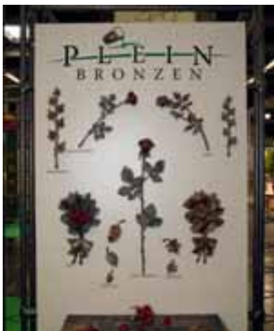
Vollplastische Blumen unter dem neuen Logo von Plein Bronzen