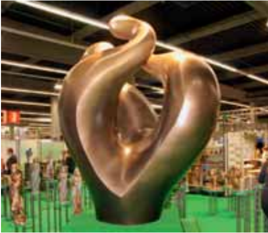
Großplastik »Flammen« des Bildhauers Pierre Renard (Plein Bronzen)