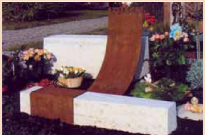
Gold 2006: Grabzeichen für einen Skater von Howard Schwämmle