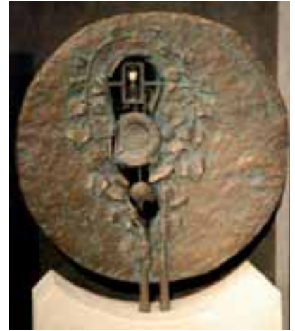
Bronze von Hermann Schilcher (Firma Binder)