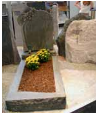
Grabmale (u.a. aus PANNONIA GRÜN) made in Austria, Firma Poschacher

Tel.: 06251/62041 www.kurz-natursteine.de