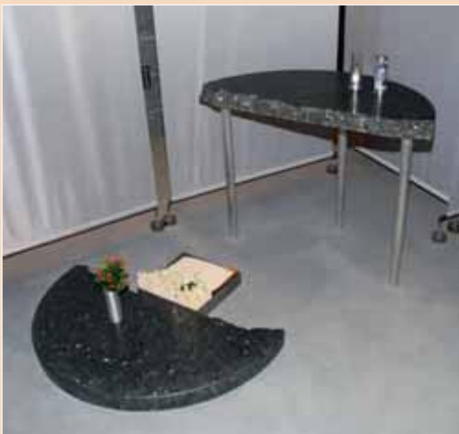
»Tisch zum Erinnern« von Uwe Spiekermann

Die Videopräsentation im Eingangsbereich der Sonderschau wurde von vielen übersehen. Wer sich darauf einließ, wurde mit Porträts von alten und jungen Menschen und guten Texten zum Leben, Sterben, Abschiednehmen und Trauern belohnt.