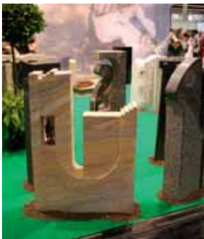
Exklusiv für Holland Graniet gestaltete Grabzeichen zum Thema Musik