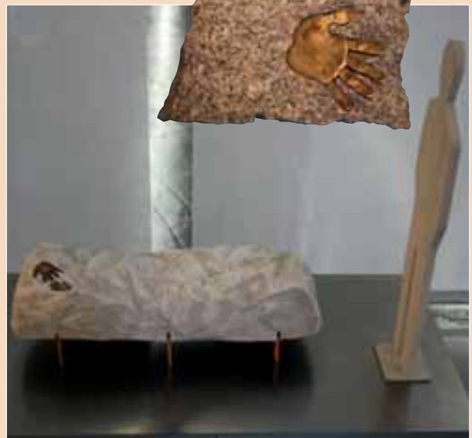
Sarkophag mit Handabdruck als Intarsie von Howard Schwämmle