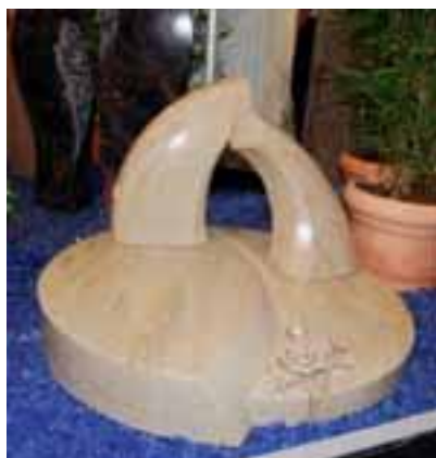
Zweiteiliges Böse-Urnengrabzeichen mit skulpturaler Anmutung aus IROKO