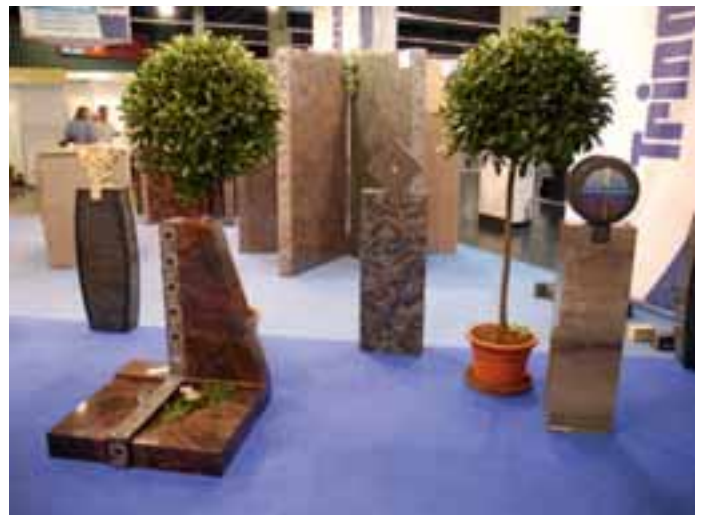
Industrielle Grundformen, gestaltete Ornamentsteine: das neue System »modular« von Tringenstein