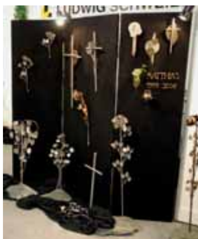
Neues Kombisystem für Urnenwände von Ludwig Schweier