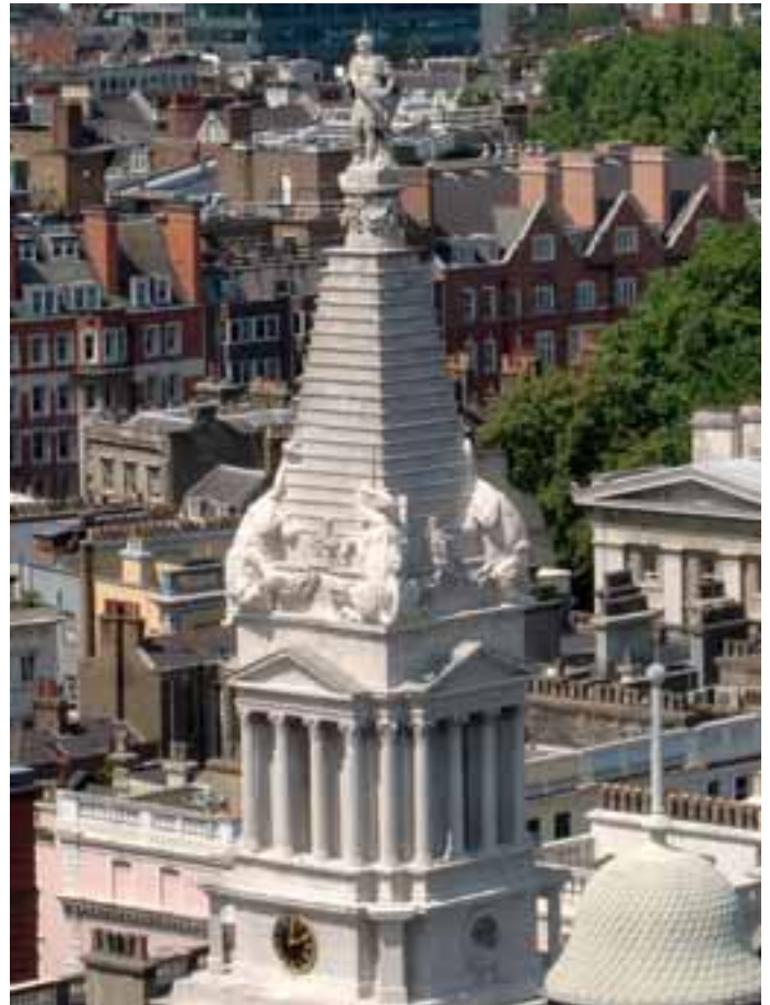
Der Turm vor und nach der Restaurierung

vier Holzstrukturen an, die präzise den Turmecken nachgebildet waren (Maßstab 1 : 3). Von diesen Tonmodellen wurden nun je zwei Gipsmodelle gegossen; je eines davon wurde in rund 20 Stücke zersägt. Die Sägekanten entsprachen dabei den späteren Fugen; sie dienten der Einpassung in die vorhandene Fugenstruktur. Anhand der Gipsblöcke wurden die von den Steinmetzen und Bildhauern benötigten Schablonen hergestellt. Das jeweils andere, intakte Gipsmodell diente als Referenzobjekt.