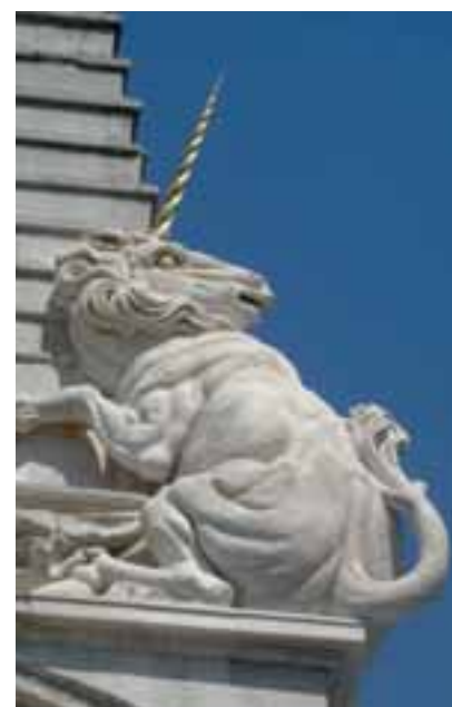
Den Originalen nachempfunden sind diese Skulpturen aus PORTLAND-Kalkstein.