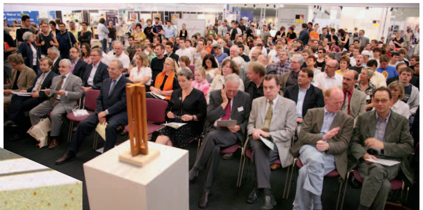
Gut besucht: die Verleihung des PPP