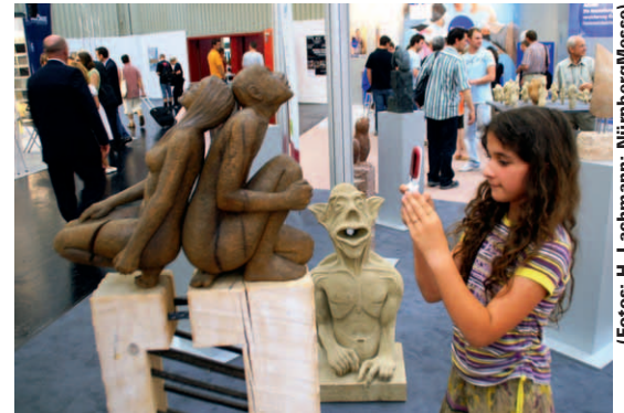
Skulpturen auf dem Stand des BIV