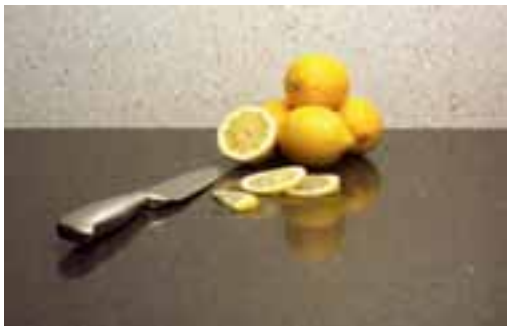
Arbeitsfläche aus Trend R-Platten

Der Natursteinlieferant Johann & Backes bietet in Zusammenarbeit mit der Sopro-Bauchemie am 24. August eine Verleges Schulung für Händler, Verleger und Architekten an. Ergänzt wird die Veranstaltung durch eine Besichtigung des Lager- und Grubengeländes, des neuen Ausstellungsmoduls und einer ehemaligen Untertage-Dachschiefergrube. Die Schulung findet von 8 Uhr bis 16 Uhr auf dem Werksgelände in Bundenbach statt.