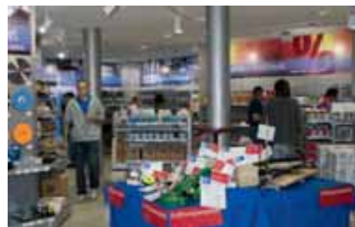
Im neuen Profimarkt der Firma König

J. König GmbH & Co. Dieselstraße 2 76227 Karlsruhe Tel.: 07 21/4 09 05-0 info@j-koenig.de www.j-koenig.de