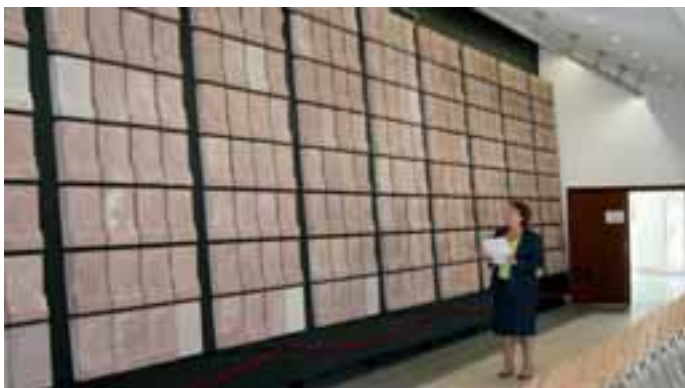
Jeder Tag des Jahres hat im Kalender der Brüderlichkeit und des Friedens einen »modernen Heiligen«.

www.ot-paysdebitche.com/all/schorbach.php