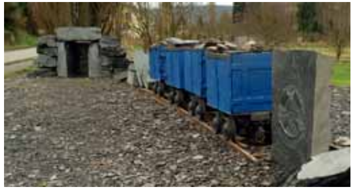
Das Denkmal an der Ortseinfahrt von Fell

»Stein und Wein«. Außerdem wurden mehrere tonnenschwere Dachschieferblöcke so aufgestellt, dass sie ein Stollenmundloch bilden. Die Loren stammen aus der Schiefergrube Rathschek bei Mayen. Die Komposition erinnert an die Bergbautradition von Fell, die bis in die Römerzeit zurückreicht. Im November wurde das Denkmal fertiggestellt, das in