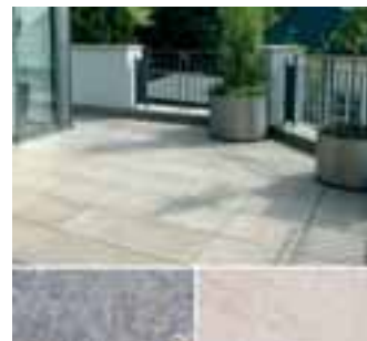
Naturstein von TRACO im Außenbereich (Bild: traco.de).

Die Ökobilanz der Sand- und Kalksteine ist sehr gut. Der Energieverbrauch bei der Herstellung sei im Vergleich zu anderen Baustoffen minimal. Steinbrüche werden nach der Nutzung oft in Freizeitgelände oder in Biotope umgewandelt. Auch eine weitere Nutzung für die Land- und Forstwirtschaft ist möglich. Abraum findet vielfach als Mauersteine, Pflaster oder Schotter Verwendung oder dient im Steinbruch zur Verfüllung.