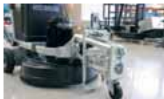
Das ALL-System von HTC

Für die Renovierung und tägliche Pflege u. a. von Terrazzo- und Natursteinfußböden, bietet HTC die Pflegelösung TWI-