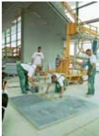
Neue Messe Stuttgart: Verlegung mit Sopro-Produkten

den mehr als 10 000 Handwerker mit dem Produktangebot und seinen Leistungsmerkmalen vertraut gemacht. Neu im Komplettprogramm zur fachgerechten Natursteinverlegung ist der Sopro MittelDickbettMörtel weiss, ein weißer, flexibler, trasshaltiger und schnell erhärtender zementärer Mittel- und Dickbettmörtel für Mörtelbettdicken bis 30 mm für den Einsatz im Innen- und Außenbereich. Er eignet sich besonders