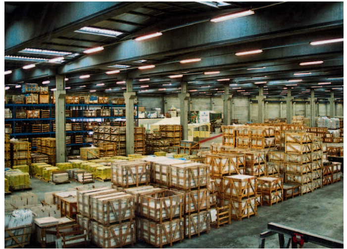
Unter dem Namen »Natural Art Collection« vertreibt der belgische Großhändler besonders exklusive Natursteine. Sie sind durch eine besondere Farbgebung oder Maserung gekennzeichnet.