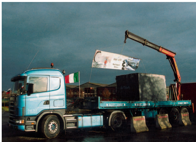
Ein LKW aus der eigenen Flotte empfing die Besucher auf dem Firmengelände. Im letzten Jahr wurde der Fuhrpark um neun Fahrzeuge erweitert.