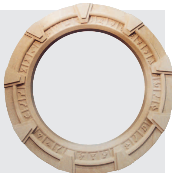
»Stargate« von Tobias Kabel, Sandstein