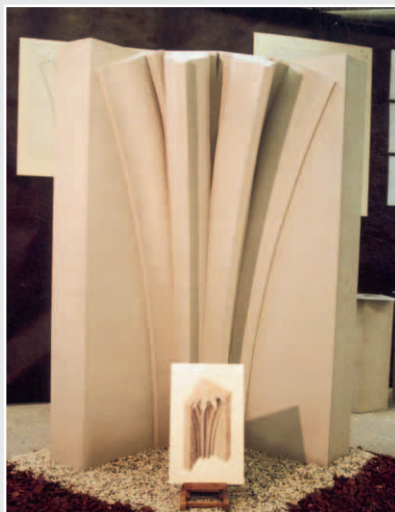
Rippenanfänger von Timo Schnatz, Sandstein