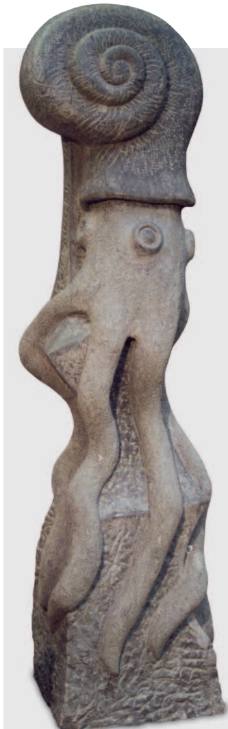
Meerestiere von Sebastian Jäger, ANRÖCHTER DOLOMIT