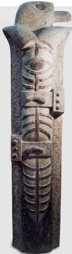
Totemstele von Jürgen Kaiser, Diabas