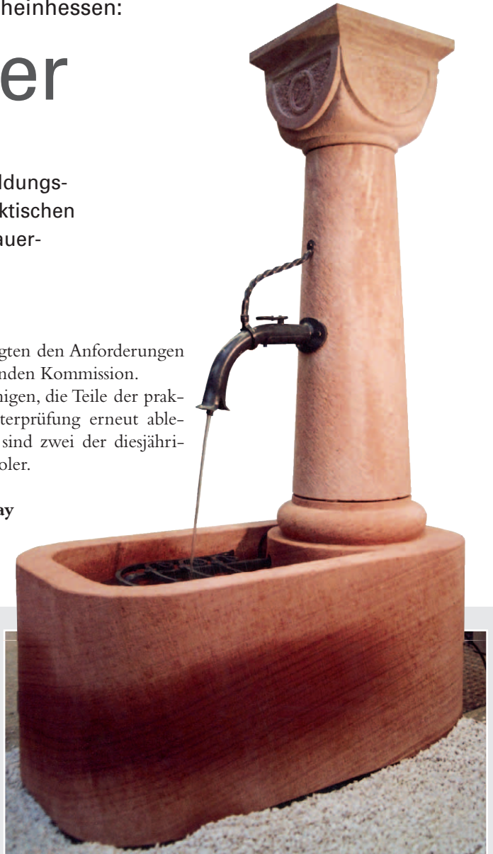
Friedhofsschöpfbrunnen von Knut Bahss, Sandstein