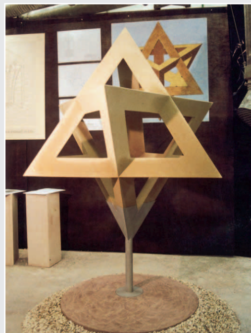
Stern von Peer Mühle, Sandstein

Anzeigenschluß für Naturstein 7/2007 ist der 20. Juni 2007