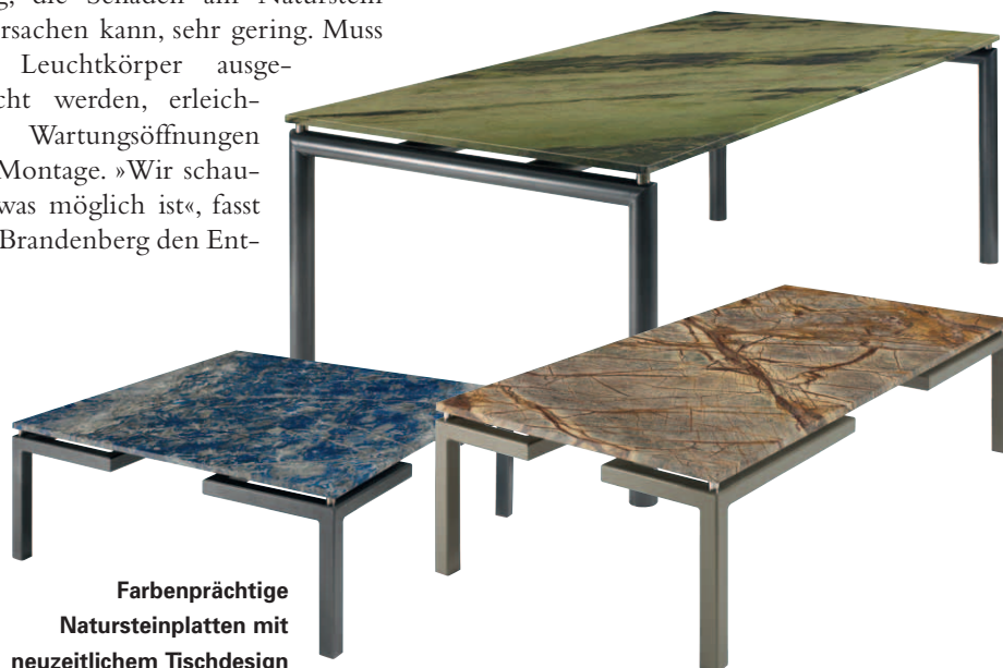
Farbenprächtige Natursteinplatten mit neuzeitlichem Tischdesign

Das gilt für Tische, Wand- und Bodenbilder, Lampen und Theken der eigenen Designlinie gleichermaßen wie für Spezialanfertigungen. Die eigene Designlinie trägt die Handschrift von Innenarchitekt Marco Herren und ist schlicht und funktional. Die Einmaligkeit der erlesenen Natursteine kommt so am besten zur Geltung, findet er. Bei Spezialanfertigung