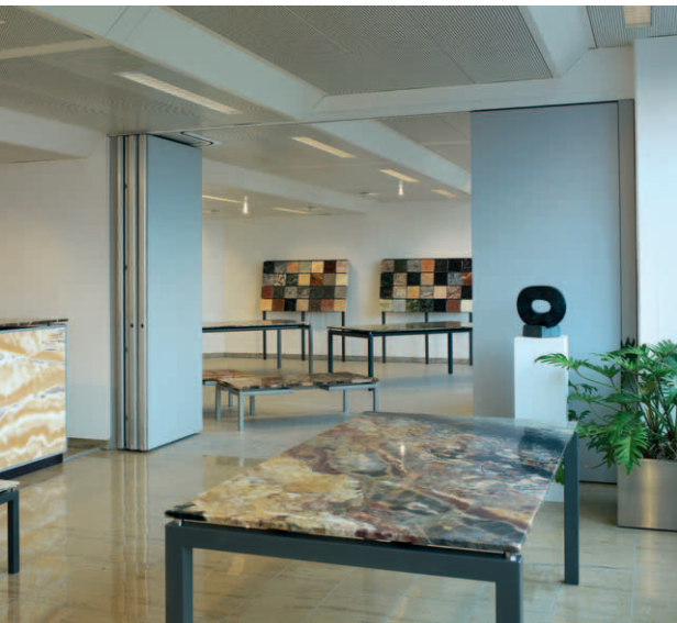
Ausstellungsraum der Inca Naturstein Design