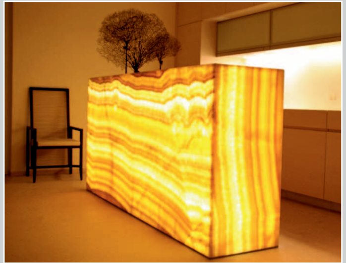
... funktional mit maßgeschneiderten Einbauschränken