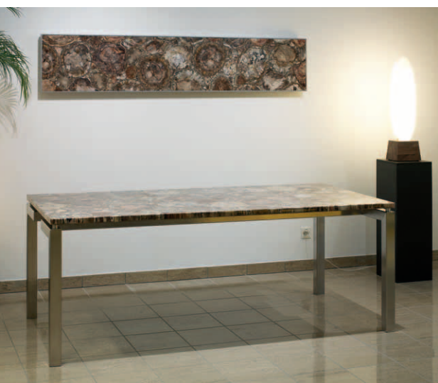
Ensemble Tisch & Wandbild »Petrified Wood« mit 220 Mio. Jahre alten Holzversteinerungen und Ammoniten