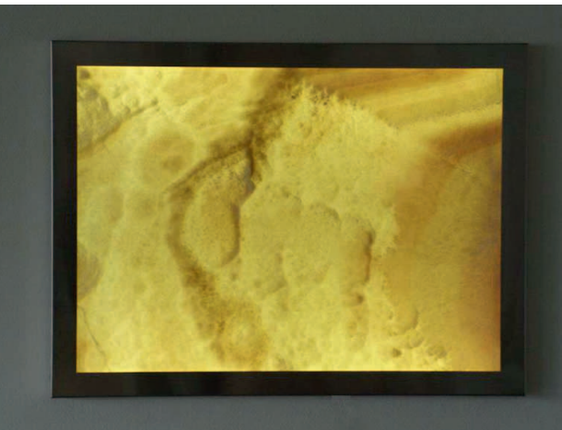
Hinterleuchtetes Wandbild aus Honig-Onyx