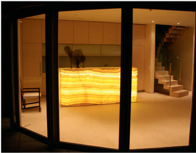
Vierseitig hinterleuchtete Onyxtheke ARCO IRIS, ...