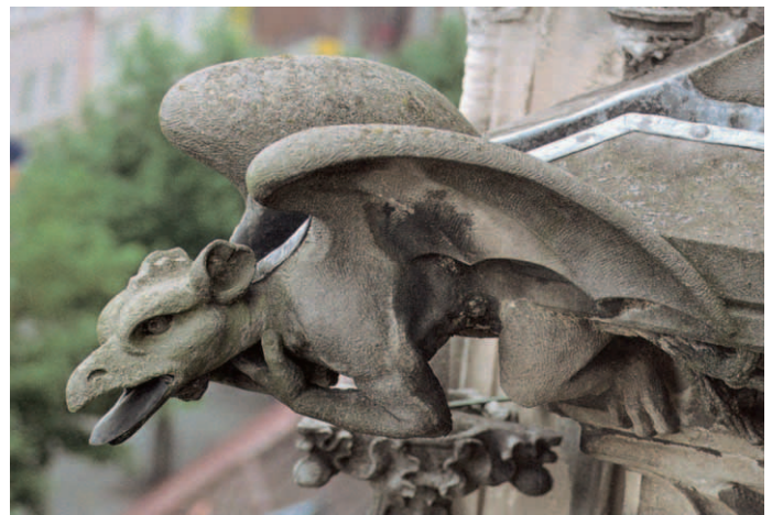
Stammt nicht aus der Rosslyn-Kapelle, ist aber irgendwie auch mystisch-mysteriös: Wasserspeier am Ulmer Münster...

Natürlich gibt es gleich neue offene Fragen. Etwa die, warum die Baumeister um 1450 ihre Musik verschlüsselt in den Stein einmeißelten, statt sie lesbar in Notenschrift oder Neumen auf-