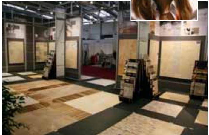
Türkische Materialien werden von Tureks professionell vermarktet.