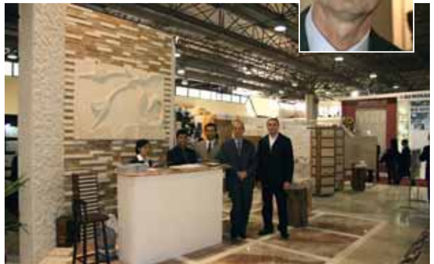
Neben eigenen Materialien bietet Metamar eine besonders hohe Verarbeitungs- kompetenz.