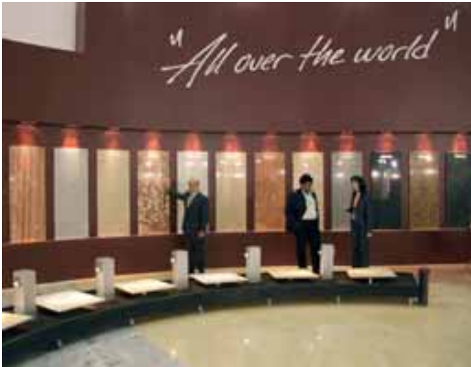
Eine Fülle von Materialien aus eigenen Brüchen hat Tekmar im Angebot.