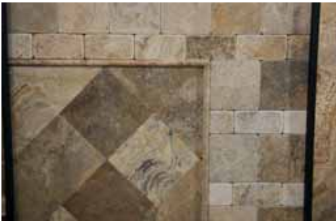
SCABOS von Tramertas