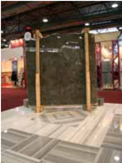
Marmara Marmor und MARON MARINACE von Efendioğlu