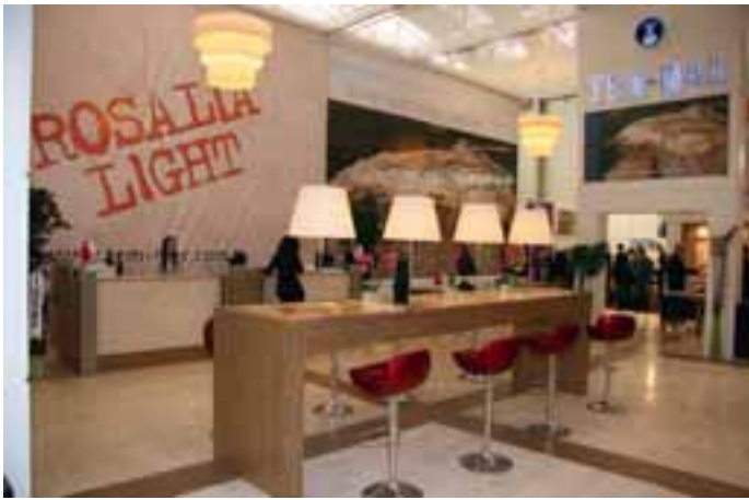
ROSALIA LIGHT gehört zum Sortiment von Tem-mer (▷ S. 128).