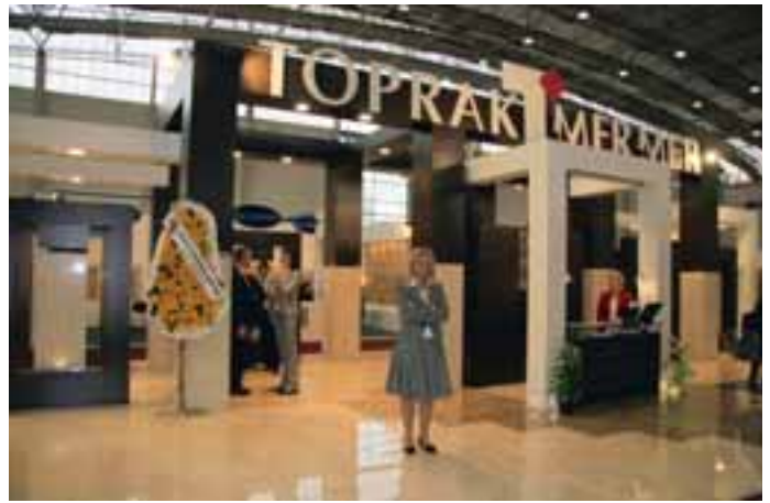
Auch in Nürnberg: Toprak mit Burcu Yilmaz von der Exportabteilung

Die Firma Toprak wurde 1996 als Gemeinschaftsinvestition von mehreren großen Werksteinfirmen ins Leben gerufen. Im Werk in Diyarbakar Lice werden jährlich 35 000 m 3 Blockware verarbeitet; die Verarbeitungskapazität beträgt 650 000 m 2 pro Jahr. Das Unternehmen verfügt über sechs Brüche (u. a. Marmor SAHARA BEIGE, BELLA BEIGE und Kalkstein TOPRAK CREAM); weitere eigene Brüche sind in Planung. Ansprechpartnerin ist Exportmanagerin Burcu Yilmaz.