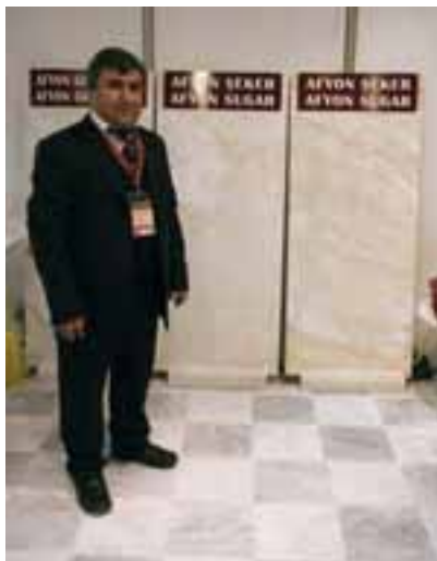
AFYON MARMOR, vermarktet von einer Kooperative