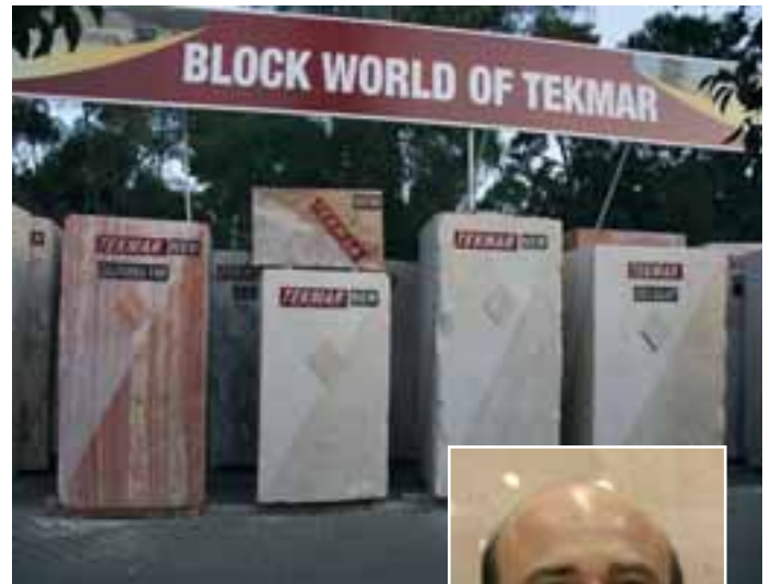
Präsentation auch im Freien