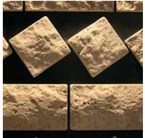
Eymer ist Spezialist für besondere Oberflächen.

starken Familienunternehmens be- läuft sich auf 40 % (4,5 US-$ jährlich). Hauptmärkte sind Griechenland, Spa- nien und die USA. Man sei für alle Kontakte offen, versicherte Geschäfts- führungsassistent Erkan Efendioğlu. Tel.: 00 90 / 2 24 / 5 86 00 08 - 09 - 10 www.efendioglu.com.tr