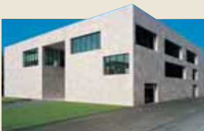
Museum Ritter, Waldenbuch

eigentlich einen Umbau bzw. eine Erweiterung eines bestehenden Hauses darstellt, ein eleganter Gesamtentwurf gelungen. U. a. werde der Charakter des Hauses maßgeblich durch die neue Fassade in hellem Travertin bestimmt, die – handwerklich perfekt – ein feines Relief als zweite Haut über den Bau-