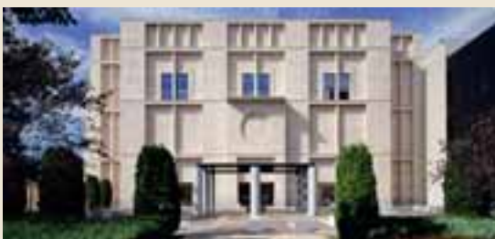
Art Museum Minneapolis, Minnesota/USA