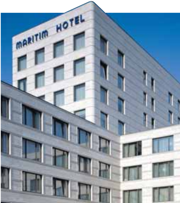
Maritim Kongresshotel, Berlin von Kleihues + Kleihues, Berlin; Römischer Travertin; Hofmann GmbH & Co. KG und Lauster Steinbau GmbH