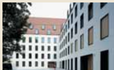
Alter Hof, München