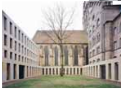
Diözesanbibliothek, Münster von Max Dudler, Berlin; OBERNKIRCHENER SANDSTEIN, Natursteinwerk Villmar GmbH

Ein in sich stimmiges, skulpturales Ensemble aus Teilen, in seiner konzeptuellen Schlüssigkeit ungewohnt im Frankfurter Kontext ordnet sich gleichermaßen der Skyline, wie auch der Topologie der unmittelbaren Umgebung unter, ja bezieht daraus im Grunde genommen seine Kraft. Der rötliche Mainsandstein ist hier weniger gestalterische Eigenwilligkeit, und auch nicht »zelebriert«, vielmehr eine bescheidene Referenz an den Ort und in all seiner Radikalität der Detaillierung ein sublimier Bezug zum Kontext und demzufolge in seiner Detaillierung konsequenterweise zurückgenommen.