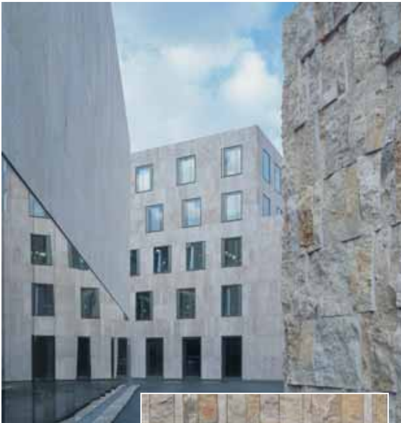
Jüdisches Zentrum München von Wandel Hoefler Lorch, Saarbrücken; GAU-INGER TRAVERTIN, JERUSALEM STONE; Lauster Steinbau GmbH