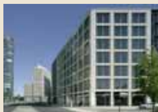
Leipziger Platz 1–3, Berlin