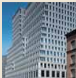
Hotel Concorde, Berlin