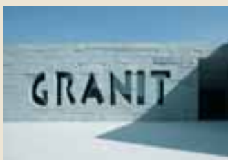
Granitzentrum Bayerischer Wald, Hauzenberg