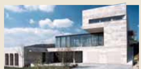
Wohnhaus mit Einliegerwohnung, Sondershausen