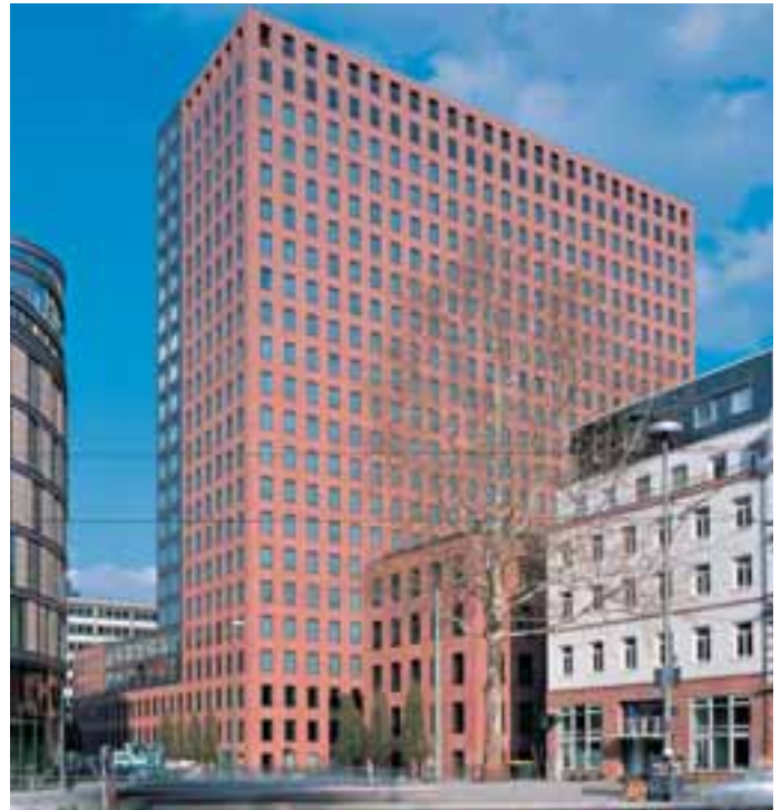
MainForum, Frankfurt, von Gruber + Kleine-Kraneburg, Frankfurt am Main; WÜSTENZELLER SANDSTEIN; Hofmann GmbH & Co. KG

körper ziehe und ihm damit klassische Eleganz verleihe. Die sorgfältige plastische Steinbearbeitung setze sich in den exakt gestalteten Details der Eingänge, Sockel und vielen weiteren kleinen Punkten fort und runde das große Thema des Bauens mit Naturstein in einer selten gesehenen Selbstverständlichkeit souverän ab.