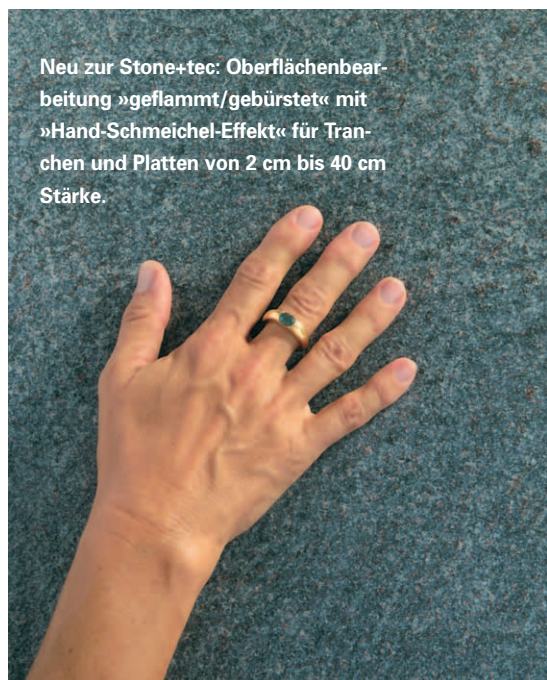
Neu zur Stone+tec: Oberflächenbearbeitung »geflammt/gebürstet« mit »Hand-Schmeichel-Effekt« für Tranchen und Platten von 2 cm bis 40 cm Stärke.

Naturstein: Wie haben Sie als Unternehmen auf diese Veränderungen reagiert?