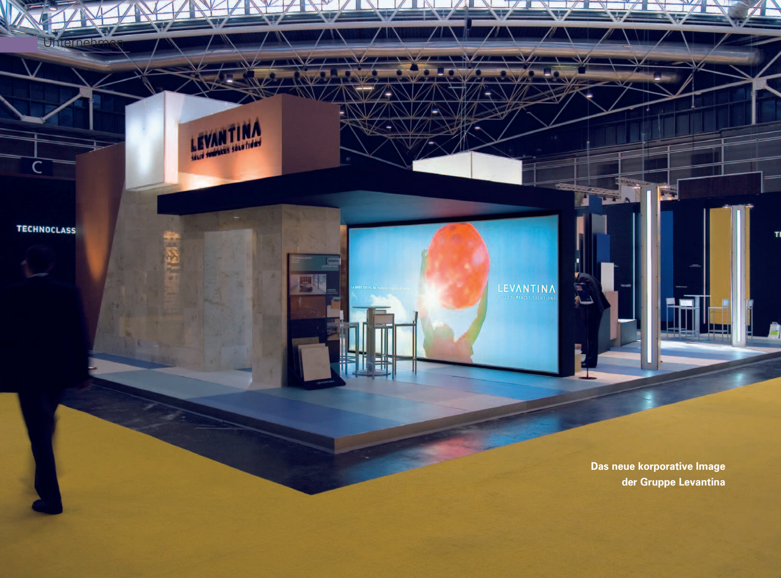
Das neue korporative Image der Gruppe Levantina