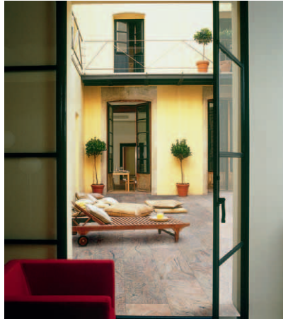
INDIAN CREEK aus der Natural Stone Granite Collection