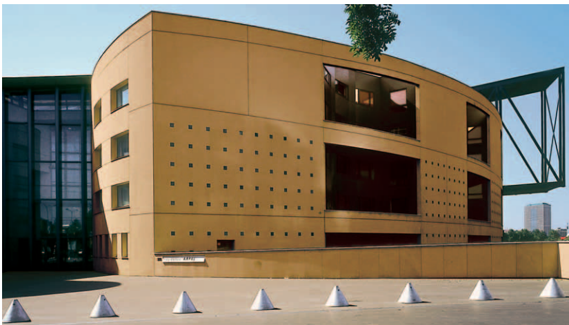
Techlam-Platten an einer Außenfassade

einer Stärke von 3 mm. Tests in Labors sowie in internationalen Forschungsinstituten haben die Qualität des Materials bestätigt. Ein Vorteil des Produkts ist laut Levantina die geringe Dicke der Platten, ihre Ästhetik und die große Vielfalt an erhältlichen Formaten. TECHLAM-Platten sind härter als Granit und leichter als Aluminium. Sie können mit herkömmlichen Methoden für Glas oder Naturstein bearbeitet und mit anderen Materialien kombiniert werden. Durch seine wärmedämmenden Eigenschaften eignet sich TECHLAM u. a. zum Anbringen an Außenfassaden. Das Material ist beständig gegenüber Temperaturschwankungen und Witterungseinflüssen.