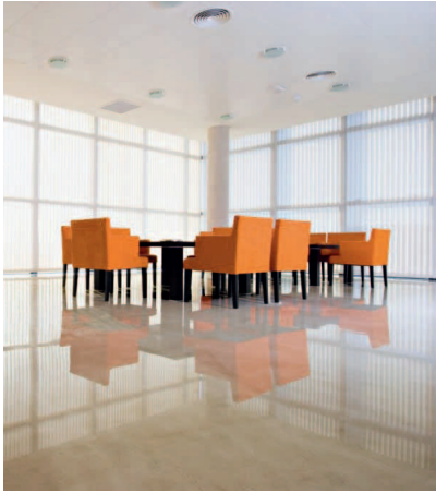
MARFIL aus der Natural Stone Marble Collection