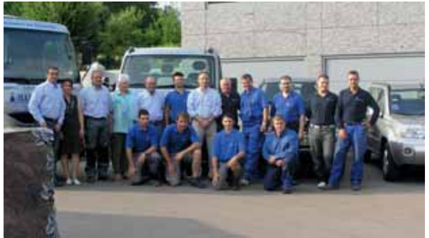
Das Team der Firma Illenberger, darunter sieben Steinmetzgesellen und ein Bildhauer