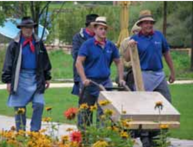
Umzug auf der Landesgartenschau in Heidenheim 2006