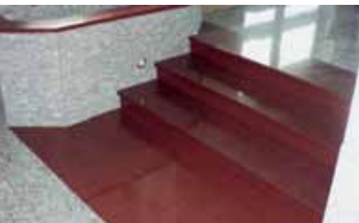
Treppendetail in Naturstein und ZODIAQ®

Naturstein Strickmann GmbH & Co. Nikolaus-Dürkopp-Str. 6 59227 Ahlen