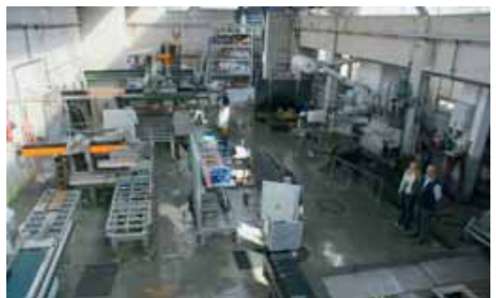
Blick in die Produktion