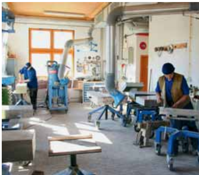
Blick in die Steinmetzwerkstatt