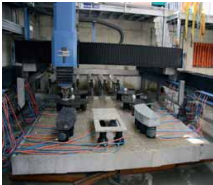
Das neue Bearbeitungszentrum von Burkhardt