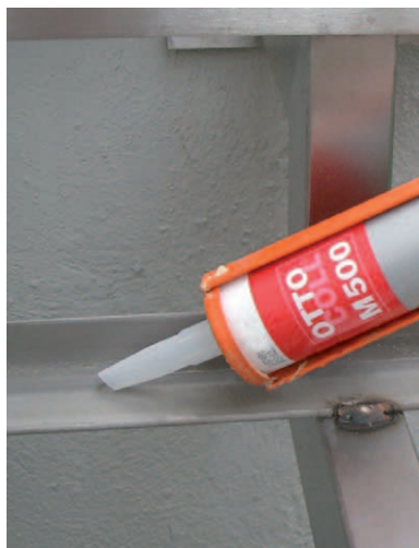
OTTOCOLL® M 500