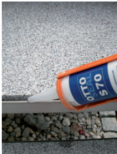
OTTOSEAL® S 70