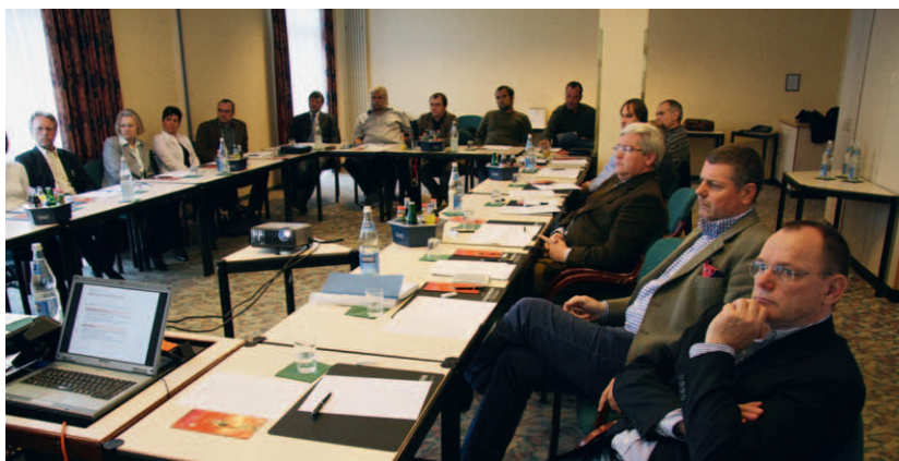
Gemeinsam für das Grabmal: die Unternehmerrunde in Deidesheim

Das Handwerk richtet sich in erster Linie nach den jeweiligen Kundenwünschen (Farbe, Gesteinssorte, Struktur) und kauft dementsprechend. Das Herkunftsland wird dann zum entscheidenden Kriterium, wenn das, was der Kunde will, nur aus bestimmten Ländern zu haben ist (z. B. AURORA aus Finnland) oder wenn der Preis im Zentrum der Kundenwünsche steht (Ware aus Indien, China). Auf der Suche nach preisgünstigen Alternativen übergehen fast die Hälfte der Befragten immer häufiger die traditionellen inländischen Handelskanäle und kaufen ausländische Ware (meist aus Indien) bei darauf spezialisierten Händlern ein (auch im