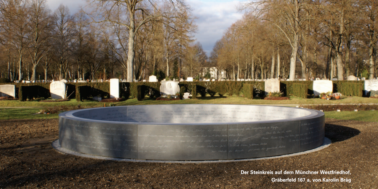
Der Steinkreis auf dem Münchner Westfriedhof, Gräberfeld 167 a, von Karolin Bräg