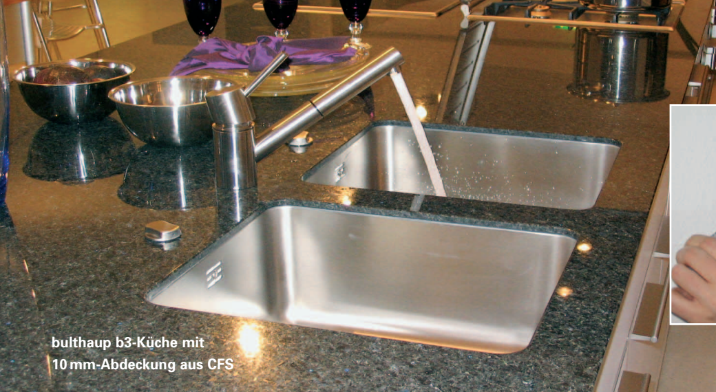
bulthaup b3-Küche mit 10 mm-Abdeckung aus CFS