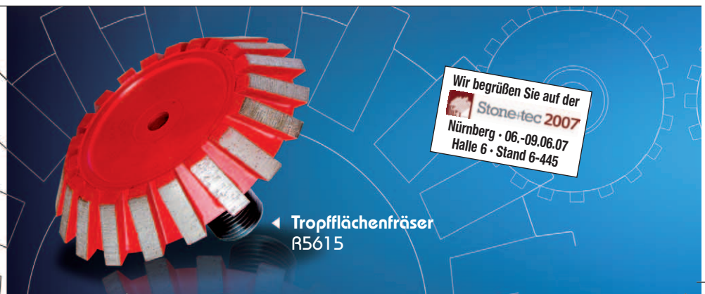
◀ Tropfflächenfräser R5615

Die Kasprick Diamantwerkzeuge GmbH fertigt für Sie seit über 30 Jahren präzise Diamantwerkzeuge. Immer mit höchstem Qualitätsanspruch und immer perfekt in Form - egal ob Sie Bohren, Fräsen, Schleifen oder Trennen.