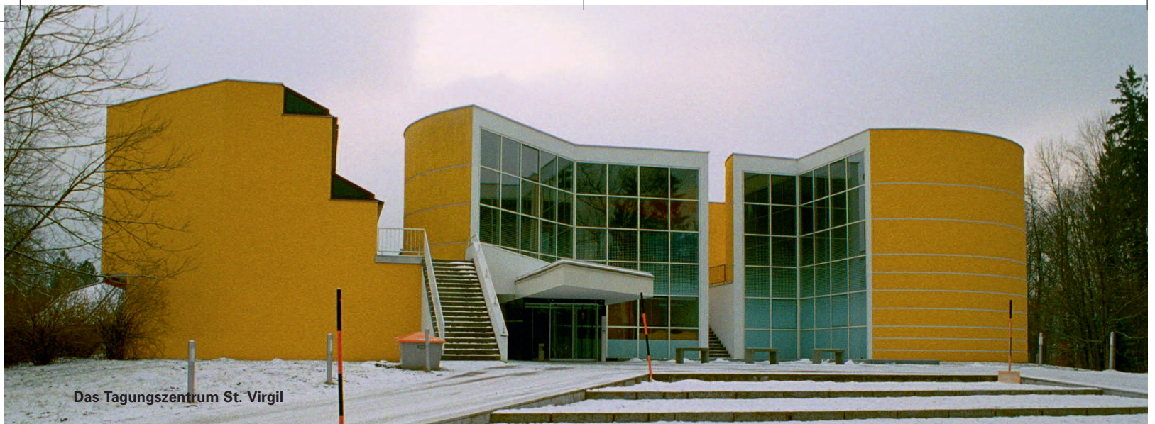
Das Tagungszentrum St. Virgil

Bildungswoche der Steinmetzmeister in Salzburg: