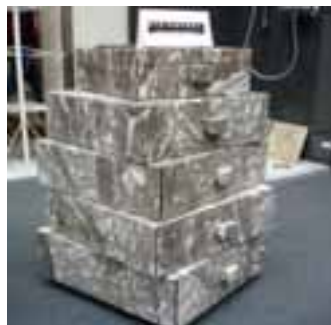
Auf der Ausstellung präsentierte Steinmöbel