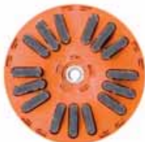
Die neue Mattschliffbürste von der J. König GmbH