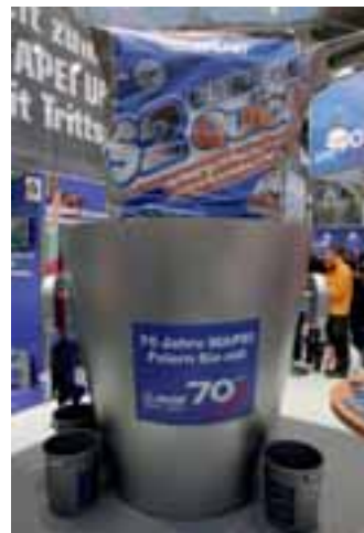
Am Stand von Mapei auf der BAU