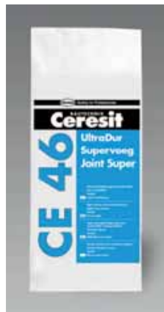
Der neue hochbelastbare Fugenfüller »CE 46 UltraDur« von Ceresit Bautechnik

Der neue mineralische Fugenfüller »CE 46 UltraDur« von Ceresit Bautechnik verfügt Dank einer neuen Rezeptur über eine besonders hohe Resistenz gegen den Befall von Mikroorganismen und ist gleichzeitig laut Hersteller besonders beständig gegen eine Vielzahl von sauren und alkalischen Reinigern. Im Gegensatz zu epoxidbasierten Fugenfüllern enthält »CE 46 UltraDur« keinerlei gesundheits-schädigende Inhaltsstoffe. Er ist an der Wand und auf dem Boden im Innen- und Außenbereich einsetzbar. Eine Anwendung in öffentlichen und privaten Bädern ist ebenso möglich wie in Küchen, auf Terrassen und sogar in Waschanlagen.