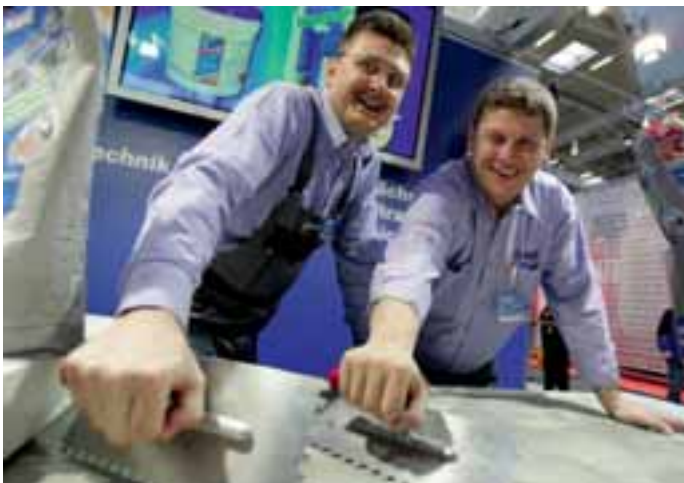
An den Mapei-Ständen auf der BAU und auf der Domotex wurden Live-Vorfürungen geboten

Mapei GmbH Bahnhofsplatz 10 63906 Erlenbach Tel.: 09372/98950 Fax: 09372/989548 mailto@mapei.de www.mapei.de