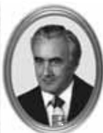
bearbeitetes und gebranntes Porzellanfoto