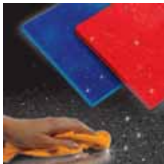
Saubere Oberflächen mit »Quarz Clean & Care«

gender und schützender Wirkung eignet sich zur Glanzauffrischung und dient der gründlichen Säuberung von Kunststeinoberflächen. Zudem verstärkt das Produkt die Widerstandsfähigkeit von Quarz-Kompositgestein gegen hartnäckige Flecken. Das Pflegemittel ist im Kontakt mit Lebensmitteln gesundheitlich unbedenklich.