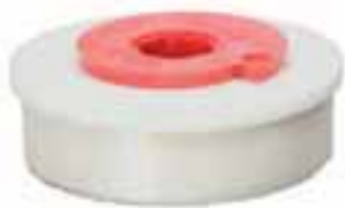
Die Tap Flex Satinierbürste

ist nicht notwendig. Somit können in der Regel Platten aus dem Lager verwendet werden. Die Tap Flexbürsten werden für stationäre Maschinen mit SV-Anschluss Ø 150 mm, Form Frankfurt oder Fickert Aufnahmen angeboten. Für den Einsatz auf Winkelschleifern gibt es eine 130 mm Version mit SV/M14 Anschluss, Körnungen K16–K400.