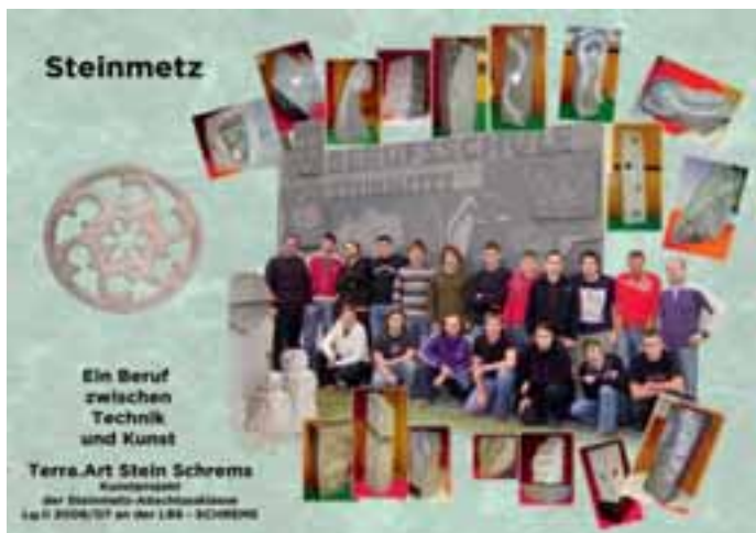
Die Steinmetzabschlussklasse der Landesberufsschule Schrems