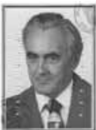
altes verblasstes Passfoto

Alte Engterstr. 8 - 10 · 49565 Bramsche Fon: 0 54 61/36 16 · Fax: 6 39 28 e-mail: tschoertner.grabmale@t-online.de