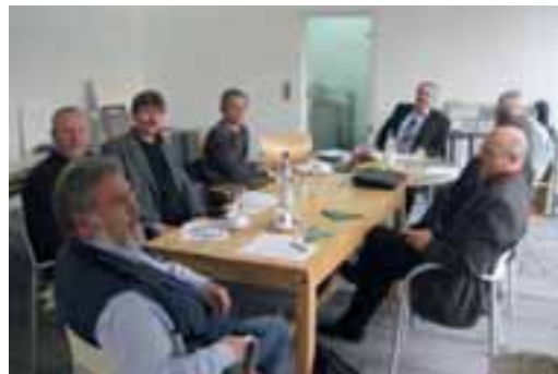
Beim Gespräch über die Ausbildungssituation des Steinmetz- und Steinbildhauerhandwerks

Weitere Themen waren die Anpassung der Berufsausbildung an die technische Entwicklung der Betriebe und an die Erfordernisse der gesellschaftlichen Entwicklung sowie die Koordination der Lerninhalte mit den Kursen der überbetrieblichen Ausbildung.