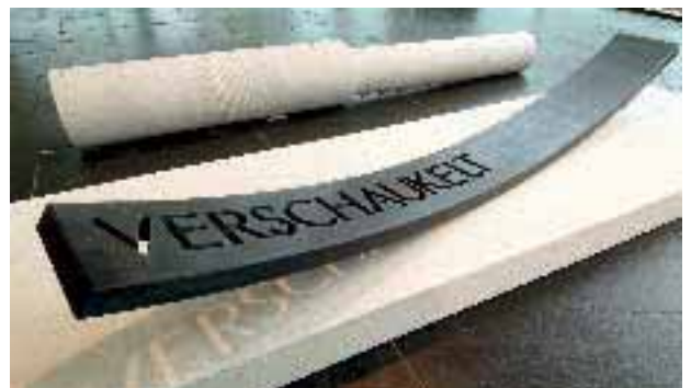
Wortstein WS VI, 1999, belgischer Granit, von Axel F. Otterbach