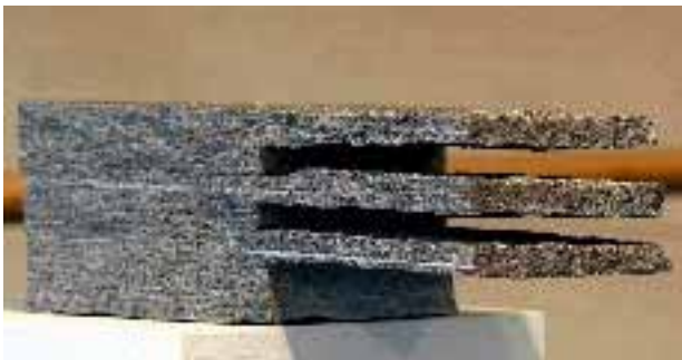
Raumschnitt 42, 2004, Gneis CALANCA, von Nikolaus Kernbach