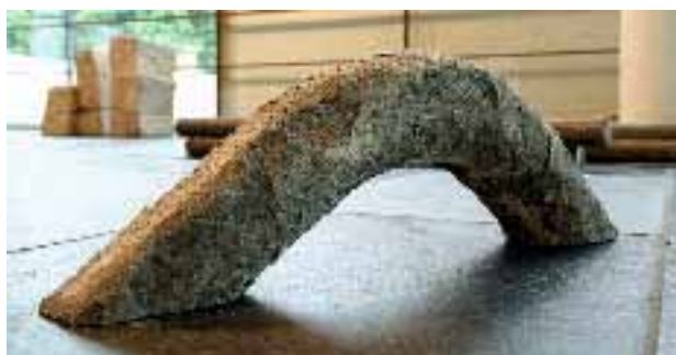
Kleiner Bogen, Sandstein, von Alf Setzer