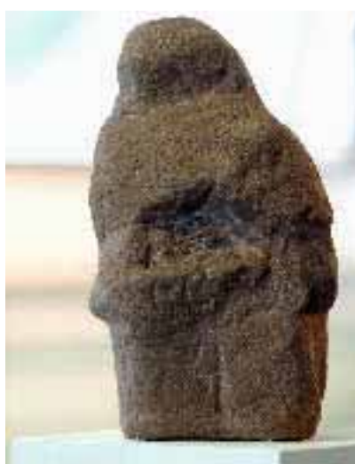
Trauer, 2005, Kalkstein, von Wendelin Matt