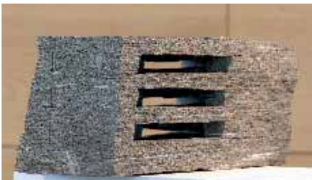
Raumschnitt 46, 2004, Gneis CALANCA, von Nikolaus Kernbach