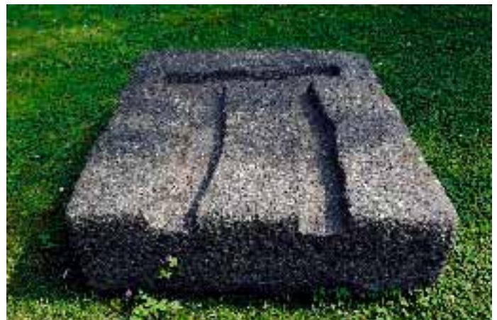
o.T., 1992, Granit, von Heike und Jiri Mayr