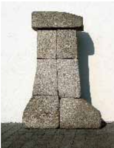
o.T. (7-teilig). 1991, Basalt, von Jiri Mayr

»Skulptur im öffentlichen Raum« ist ein Thema, das in Anbetracht dieser Ausstellung Erwähnung finden soll. Keineswegs wurde eine Neutralität des Ortes vorgetäuscht; die Eigengesetze einer Ausstellung blieben ge-