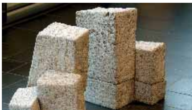
o.T. (8-teilig), 1993, Muschelkalk, von Heike Mayr