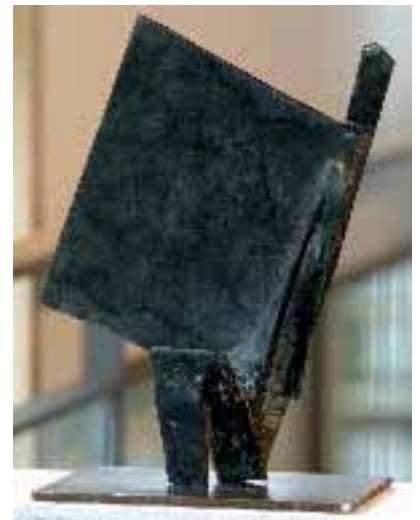
Aufbruch, 2005, Diabas, von Josef Nadj