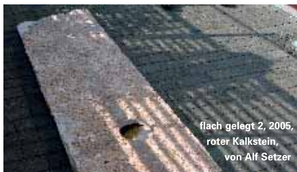
flach gelegt 2, 2005, roter Kalkstein, von Alf Setzer