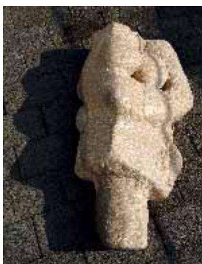
Besiegt, 2006, französischer Kalkstein, von Wendelin Matt