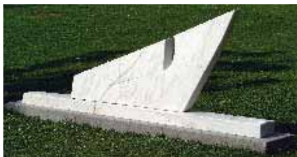
Geteilter Schatten, 1993, ESTREMOZ, von Rotraud Hofmann