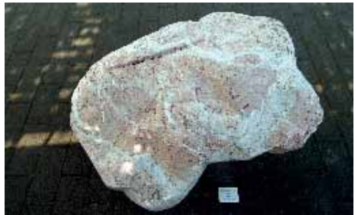
FS 90, 2006, roter Kalkstein, von Hubert Kaltenmark