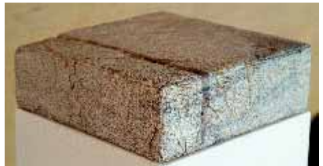
FS 77, 1997, Lahnmarmor, von Hubert Kaltenmark