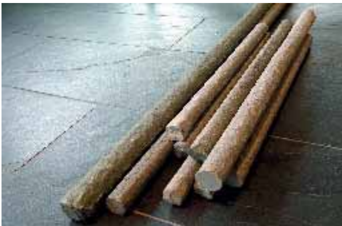
Grüner Stab, Sandstein, von Alf Setzer