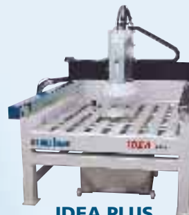
IDEA PLUS Graviermaschine