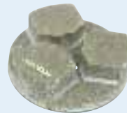
TYP 50 Kantenschleifring

Ihr direkter Draht zu uns! +49(0)8231/6007-179