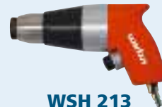
WSH 213 Drucklufthammer