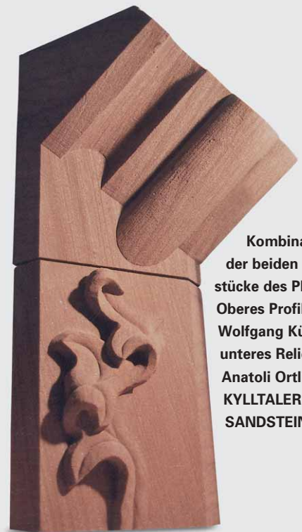
Kombination der beiden Siegerstücke des PLW. Oberes Profilstück: Wolfgang Küpper. unteres Relief: Anatoli Ortlieb, KYLLTALER SANDSTEIN