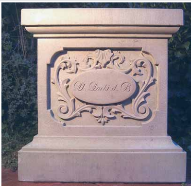
Postament mit Ornament, Gesellenstück von Markus Böhm (Niedersachsen), UDELFANGER SANDSTEIN