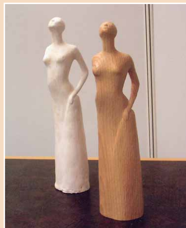
Frauenfiguren, Holzbildhauerarbeit von Monika Krajka (Baden-Württemberg)