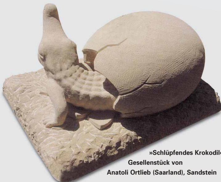
»Schlüpfendes Krokodil«, Gesellenstück von Anatoli Ortlieb (Saarland), Sandstein