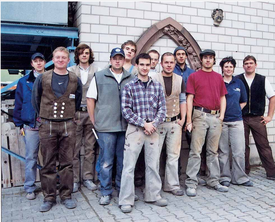
Die Landessieger und PLW-Teilnehmer

Fünf Bundessieger gingen in diesem Jahr aus dem Praktischen Leistungswettbewerb der Steinmetz- und Steindhauerbildhauerjugend (PLW) hervor, der am 4. November in Mainz stattfand. Im Wettbewerb »DIE GUTE FORM IM HANDWERK – Handwerker gestalten« wurden Preise für das beste Design vergeben.