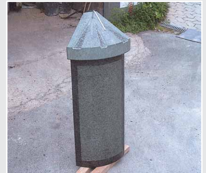
Sonnenuhr, Gesellenstück von Marc Schumacher (Rheinland Pfalz), Diabas