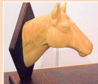
Holzbildhauerarbeit »Pferdekopf« von Garbor Rietdorf (Brandenburg)