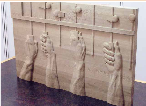
»Kickernde Hände« von Jonas Schröder (Schleswig-Holstein)