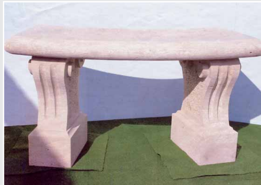
Parkbank, Gesellenstück von Manus Schwabe (Berlin), RHEINSDORFER SANDSTEIN