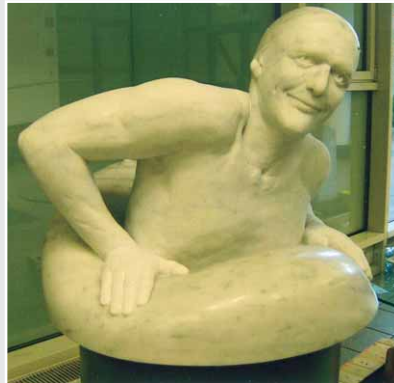
Erster Platz im Wettbewerb DIE GUTE FORM (Steinbildhauer): »Schwimmer« von Kuno Mainzer (Nordrhein-Westfalen)