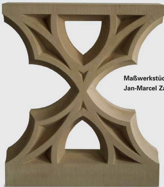
Maßwerkstück von Jan-Marcel Zander