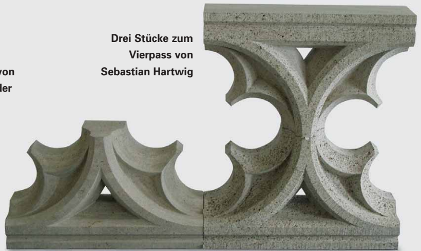
Drei Stücke zum Vierpass von Sebastian Hartwig

Werksteine Bodenbeläge Treppen Fassaden Rohplatten Grabmale Massivstücke auch profiliert