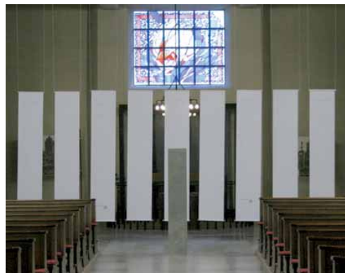
Lebensläufe in der St. Agatha-Kirche in Dorsten