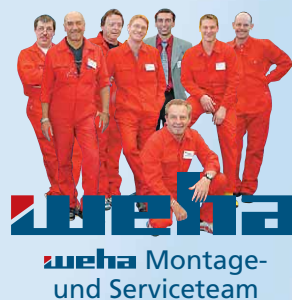
weha weha Montage- und Serviceteam