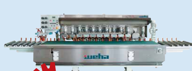
COMANDULLI professionelle Kantenschleifmaschinen