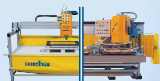
ATLAS TORO M.U.L.T.I. manuelle Bearbeitungszentren