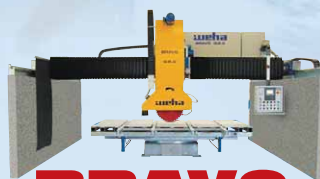
BRAVO Brückensägen für Handwerk und Industrie