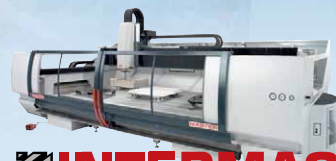
INTERMAC Computergesteuerte Bearbeitungszentren