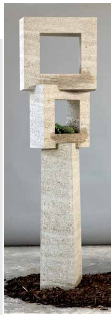
»Lebensraum« von Julia Gebel, Gartenstele aus KRENSHEIMER MUSCHELKALK