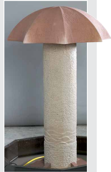
»Schirm-Brunnen« von Andreas Schaffert, roter und hellbrauner Sandstein