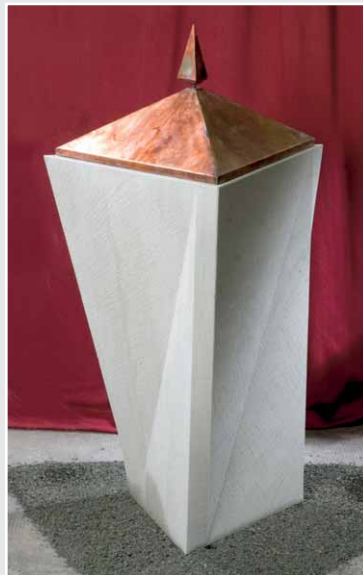
Taufbecken von Björn Meiering, KLAUBHOLZER SANDSTEIN