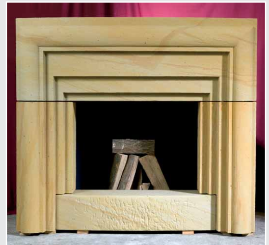
Kaminmaske von Stefan Wegner, Sandstein gelb gebändert