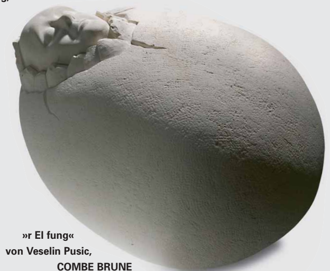
»r El fung« von Veselin Pusic, COMBE BRUNE