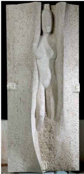
»Aufbruch« von Till Apfel, KRENSHEIMER MUSCHELKALK