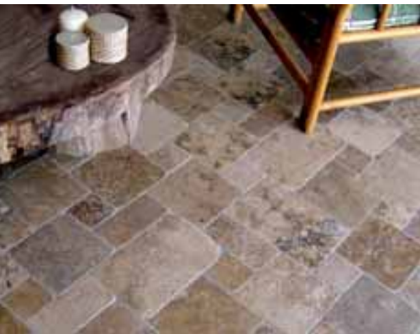
Steine mit Flair – im Bild Bodenbelag aus ANDINO DARK