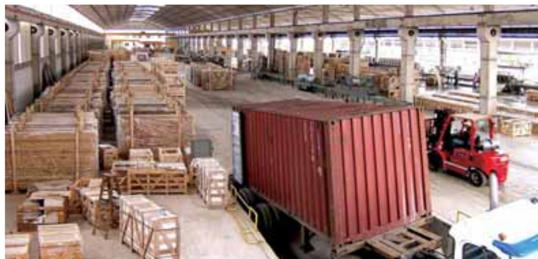
Produktion im Werk 2