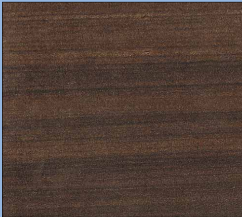
S009 Jupiter holzartig, geschliffen