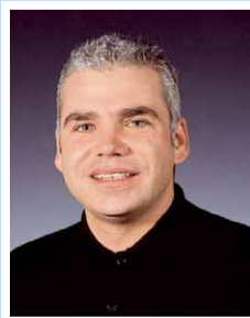
Ralf Pötzsch Anzeigenleitung Tel. 07 31/152 0158

Damit bietet ISI ein hervorragendes Werbeumfeld für Natursteinprodukte »Made in Europe«!