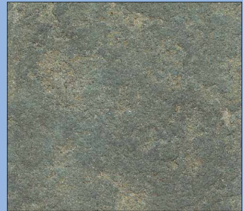
S009 Jupiter B, geflammt

S009 Jupiter holzartig und S009 Jupiter B stammen aus dem gleichen Steinbruch, werden aber in unterschiedlichen Richtungen geschnitten