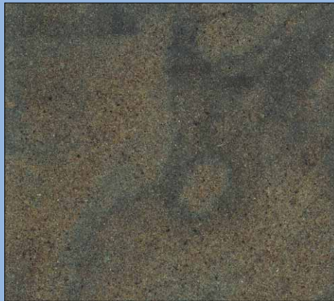
S009 Jupiter B, geschliffen