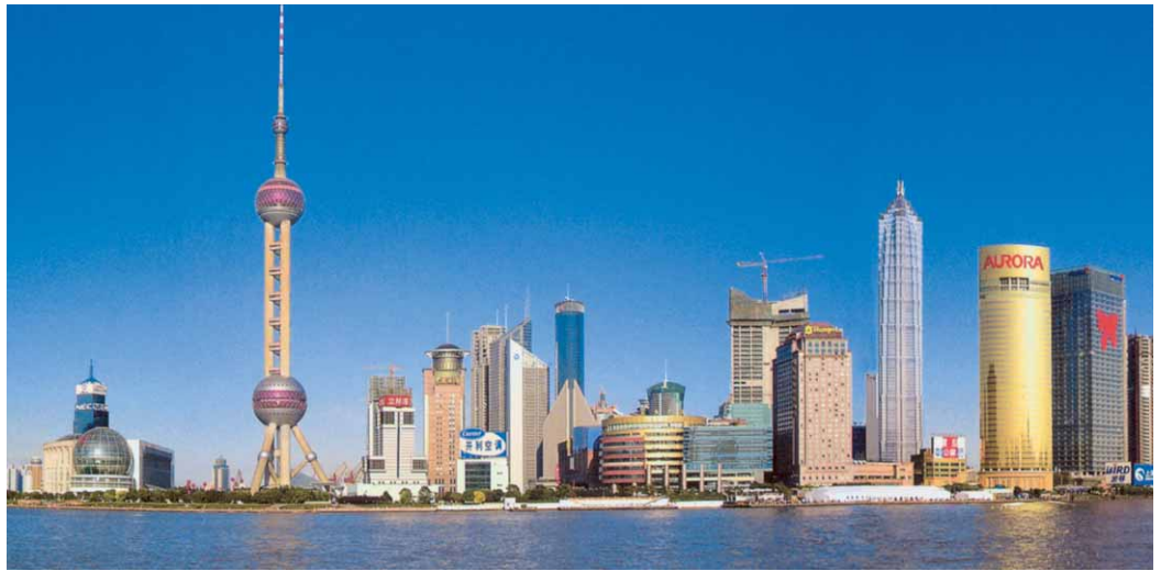
Alles nur geklaut? Die Skyline von Pudong, Sonderwirtschaftszone in Shanghai

Es ist nicht das erste Mal, dass China ganze Städte kopiert. Schon vor gut einem Jahr schimpfte die britische Presse über British Town im zentralchinesischen Chengdu, eine detailgetreue Nachbildung der Stadt