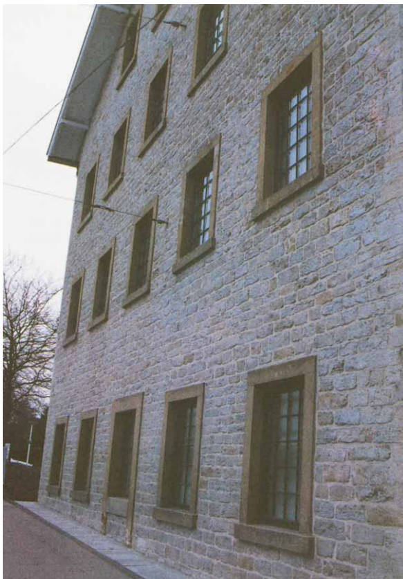
Teilansicht des Gebäudes

Das Landgericht beauftragte den Sachverständigen damit, ein Gutachten zu erstellen. Dabei sollte er