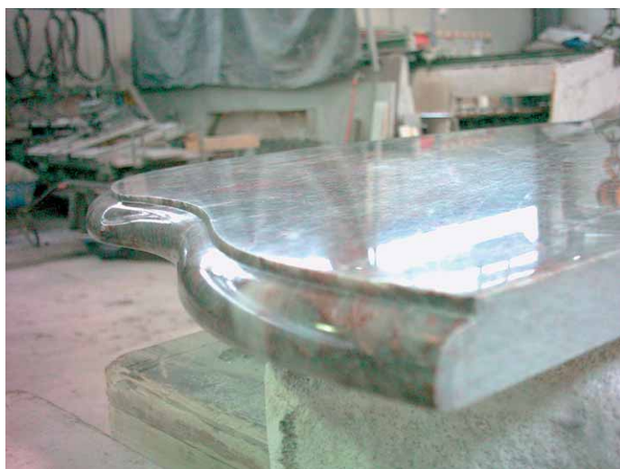
In Steffen Blazejovskys Werkstatt nachgefertigte Tischplatte