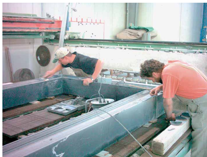
Portale und Türgewände wurden im Natursteinwerk Bischofswerda restauriert bzw. neu gefertigt.