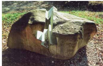
Skulptur aus der Serie »X – Yin und Yang«, 2003, Granit mit dem Seil gesägt, 270 x 140 x 240 cm

»Sieht sich der Mensch als Krone der Schöpfung (westliches Weltbild) oder als Teil der Natur bzw. des Kosmos (Vorstellungswelt Asiens)?«, fragt der österreichische Bildhauer Gottfried Hoellwarth. Er war mit zwei Arbeiten aus Naturstein beteiligt an der Ausstellung »DeNatura – Bernhard Schultze und Parallelwelten« im Künstlerhaus Wien, die vom 28. Juli bis zum 17. September das Spannungsfeld zwischen Natur und Kunst thematisierte. »Alles entspringt der Natur und kehrt zu seinem natürlichen Ursprung zurück«, so Hoellwarth. In seinem Werk sei die Natur in Gestalt eines durch natürlich geformten Steinblocks präsent und somit nicht nur Material, sondern »gleichberechtigter Teil meiner Kunst«. Das natürliche Wesen des Steins und seiner Oberfläche