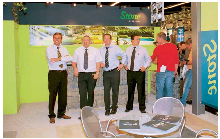
Erntete viel Lob für den neuen Messestand: das Team von Stone N.V.

Kinding im Altmühltal, wichtiger als die Suche nach neuen Sorten und Mittelpunkt der Firmenstrategie. Auch bei seinen Gabionen setzt er dieses Prinzip um, indem er neben den klassischen Steinkörben aus Drahtgeflecht auch solche mit zusätzlichen Fassungen aus Edelstahl anbietet. Nach seiner Erfahrung »holt der Naturstein gegenüber dem Betonwerkstein auf«, da hier viel, was ehemals reine Handarbeit war, nun kostengünstiger mit Maschinen gemacht werden kann.