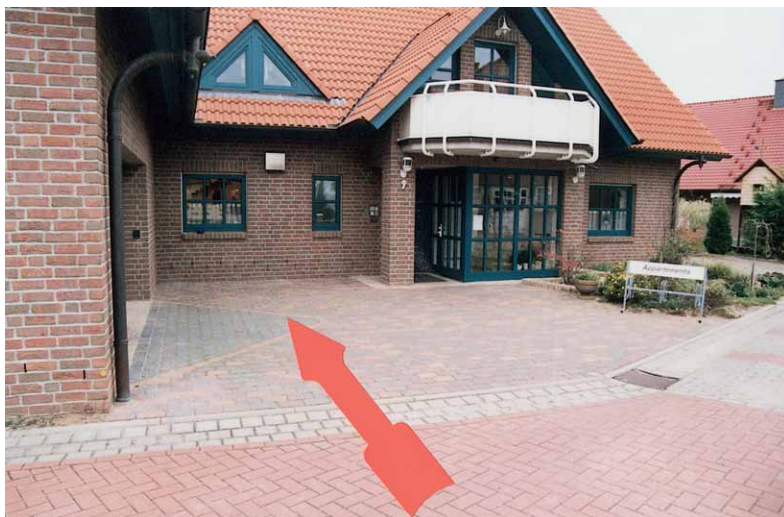
Eingangsbereich mit Gefälle zum Haus

Die Richterin vom Landgericht gab dem Autor dieses Berichts den Auftrag, im Rahmen eines Gutachtens folgende Fragen zu klären: Hat der Unternehmer die in der Auftragsbestätigung benannten Leistungen erbracht? Haben sich tatsächlich Quader gelöst? Hat das Pflaster tatsächlich ein falsches Gefälle? Ist die