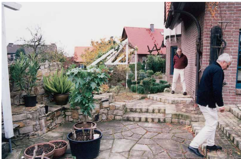
Privatgarten mit Holzkonstruktion, 50 cm über Grenze