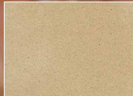
S001A2 Venus, Honed