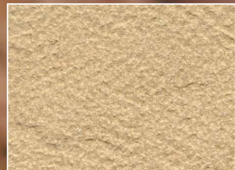
S001A2 Venus, Bushhammered