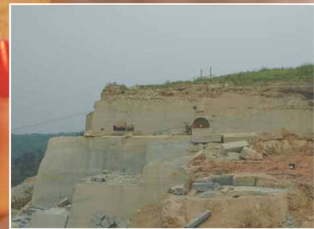
Quarry of S001A2 Venus