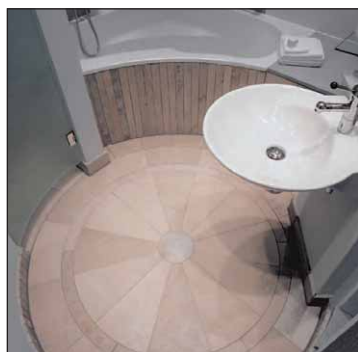
Gästehaus Röttner Nürnberg

* Je nach Bedarf abdichten mit Superflex D2 oder Superflex D1.