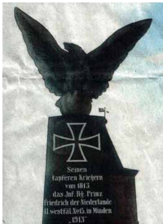
Befreiungsdenkmal (noch) mit Adler

Tja, wie heißt es so schön: Lieber den Spatz auf dem Dach als die Taube in der Hand ... und am allerliebsten den Adler wieder auf dem Sockel – das wünschen sich die Bürger aus Gadegast. Denen wurde das Symboltier vom Befreiungsdenkmal geklaut. Der Obelisk auf einem Sandsteinsockel war 1913 bei der Kirche errichtet worden, zum Gedenken an ein Rückzugsgefecht, das 1813 zwischen Gadegast und Zalmdorf im Zuge der Befreiungskriege gegen Napoleon stattfand.