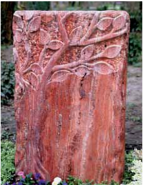
Viola Genthe-Stade, Strausberg, Travertin Rot, Oberfläche geschlifren, Seiten bossiert und überschlifren