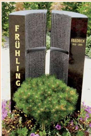
Norbert Schlick, Zell (Entwurf: Staatl. Fachschule Wunsiedel)