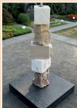
Skulptur »Vergängliches«. Die Stücke dazu entste- hen in einer Lebenden Werkstatt.