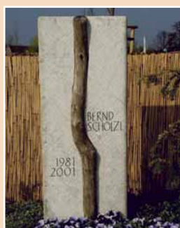
Tobias Neubert, Hals- brücke, Marmor und Eiche