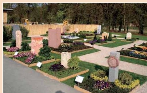
Die Grabmalausstellung auf der sächsischen Landes- gartenschau

Neben der Mustergrabanlage betreiben Steinmetzen und Friedhofsgärtnern einen Beratungsstand. In der Lebenden Werkstatt hauen wechselnde Kollegen Werkstücke im Format 30 x 20 x 20 cm. Aus diesen Teilstücken entsteht eine Skulptur mit dem Titel »Vergängliches«.