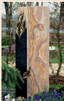
Hütter Natursteine, Haldensleben