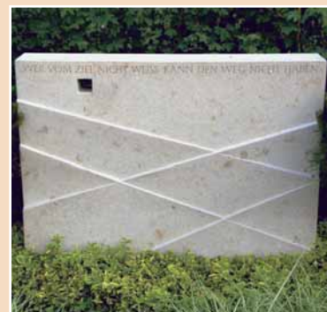
Damm Steingestaltung, Edermünde, Jura, frei vom Hieb