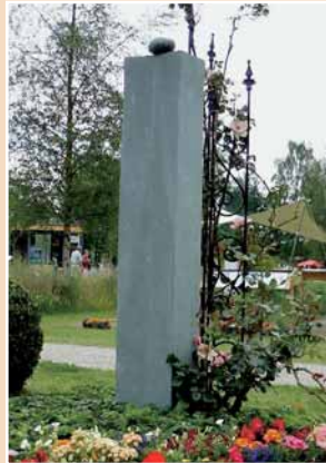
Uwe Spiekermann, Langenhagen, ANRÖCHTER DOLOMIT, matt geschlifren (Gold)