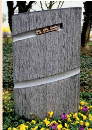
Andreas Vogel, HOHWALD SYENIT, allseitig geriffelt und überschlifren, umlaufende Hohlkehle