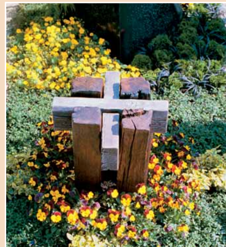
Helmut Kubitschek, Freiburg: »Kreuz-Urnenstele«, Eiche, Fichte