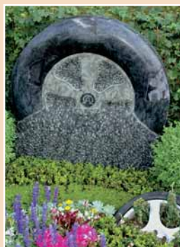
Willi Rode GmbH, Lohfel- den, Diabas mit Gummi- autoreifen, gespitzt, geriffelt, angeschliffen