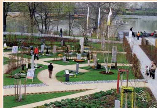
Übersicht über die Mustergrabanlage in Wernigerode