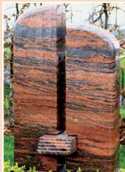
Steinmetzbetrieb Hell- mund, Wernigerode