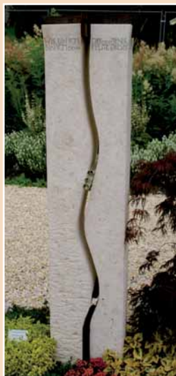
Günter Lang, Eichstätt