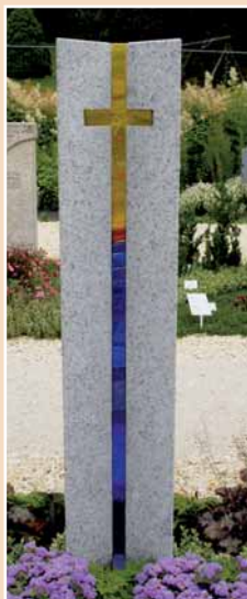
Ludwig Popp Granitwerk, Schnurbach-Waldershof, KÖSSEINE GRANIT