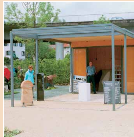
Lebende Werkstatt auf der Landesgartenschau in Heidenheim

Entwürfen für Urnen-, Doppel- und Einzelgräber wählte eine Jury 28 aus, die auf der Landesgartenschau verwirklicht wurden. Auch die Gärtner, die die Grabanlagen bepflanzen, wurden von Juroren bestimmt.