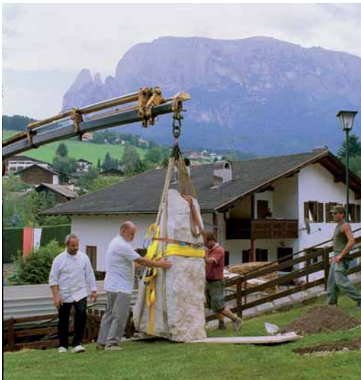
Das 1. Völser Bildhauersymposium in Südtirol war ein voller Erfolg. Was die Teilnehmer in nur einer Woche aus Jurakalkstein geschaffen haben, zeigen wir ab Seite