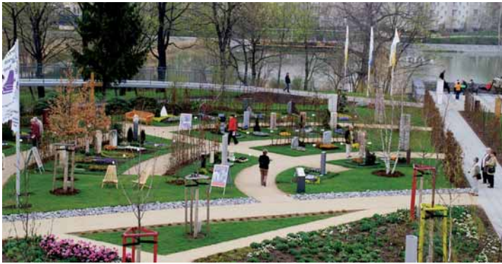
Auf sieben Landesgartenschauen ist das Steinmetzhandwerk mit Mustergrabmalen vertreten. Wir berichten ab Seite