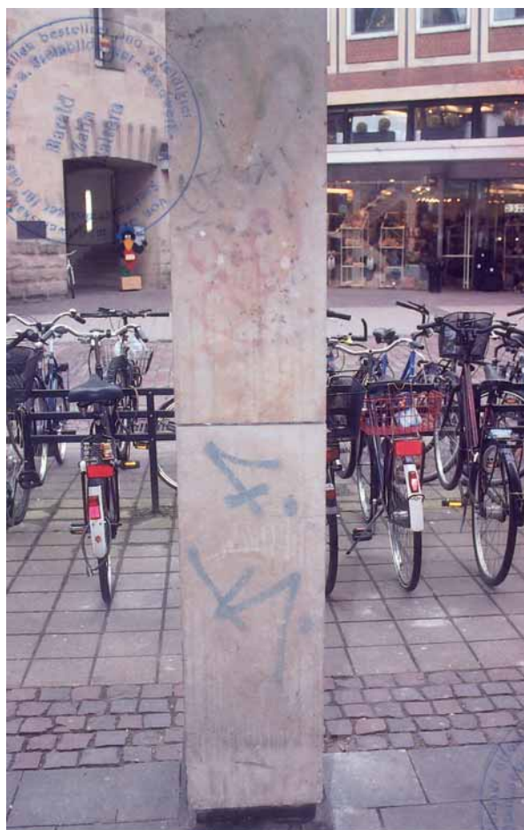
Stützenbekleidung mit Graffiti-Spuren

Der Sachverständige stellte ca. 20 Fassadenplatten mit senkrechten Läuferbildungen fest. Die Ursache: Um die Schmutzpartikel gänzlich zu lösen und abzutransportieren, hätte man das aufgebrauchte Reini-