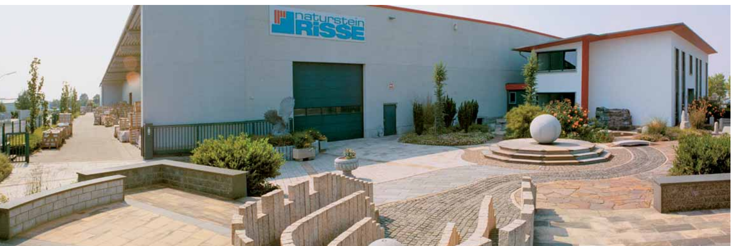
Das Außengelände ist liebevoll gestaltet.