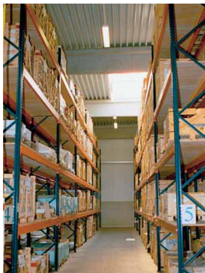
Hochregallager der Firma Risse

Der Lagerbestand wird laufend aktualisiert.