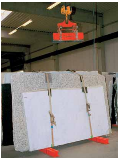
Eine Unmaßplattenhalterung Marke Eigenbau gewährleistet sicheren Transport.