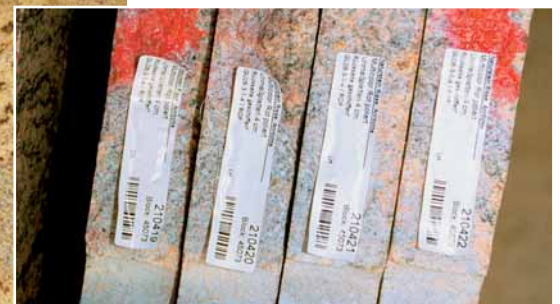
Jede Unmaßplatte wird codiert und digital erfasst.