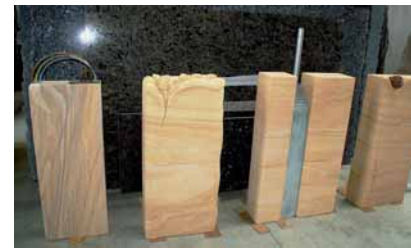
Grabzeichen aus ASIA DORATO

Raum für Diskussionen bot die Präsentation eines innovativen Fassadensystems, bei dem die Platten (bis 1 cm Stärke) ähnlich wie Autoscheiben mit einem schnell aushärtenden Spezialbindemittel verklebt werden. Vorerst sei diese Technologie nur per Ausnahmegenehmigung durch die Baubehörden einsetzbar, informierte Adam. Im sächsischen Grimma werde das Verfahren bereits angewendet. Besondere Vorzüge des