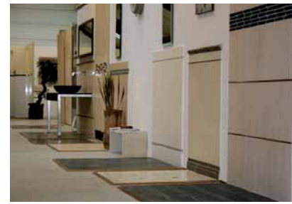
Ausstellung der Firma Naturstein+Dekor

Naturstein+Dekor Koop Handelsgesellschaft mbH Stawedder 31 25462 Rellingen Tel.: 041 01/4 78 90 Fax: 041 01/47 89 18 info@naturstein-dekor.de www.naturstein-dekor.de