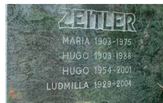
Grabstein mit korrigierter Inschrift

Die gesamte Reparatur (ohne Neugravur) dauerte lediglich zwei Stunden. Der Grabeigentümer ist sehr zufrieden mit dem Ergebnis. Auf der Basis dieser posi-