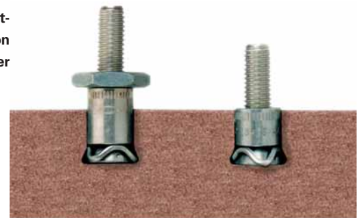
Hinterschnittanker FZP von fischer

det werden. Die minimalen Randabstände liegen bei 50 mm für die Fassadenplatten und bei 40 mm für die Leibungsplatten. Das neue Berechnungsverfahren berücksichtigt die charakteristischen Versagenslasten einzelner Gesteine sowie die tatsächlich auftretenden Belastungen und die vorhandenen Abmessungen der Fassaden- und Leibungsplatten. Durch das vereinfachte Bemessungsverfahren können die Platten bei der