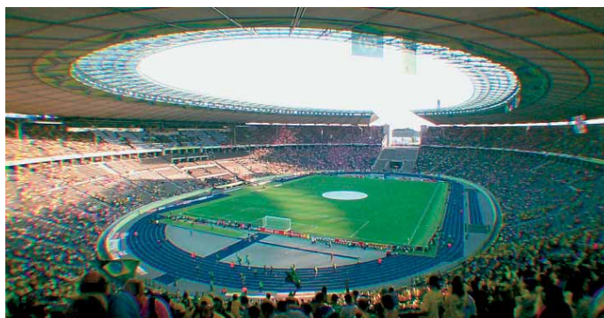
Das umgebaute Berliner Olympiastadion

Vor dem Wiederanbringen an das Außenmauerwerk waren die sensiblen Natursteinplatten in einer Gesamtflächengröße von 30 500 m 2 nummeriert und kartiert worden. Parallel dazu erfolgte der Einbau von Stahlbetonkonstruktionen zur Aufnahme der Stützen des neuen Dachs. Die Haupt-, Tangential- und Radialträger wurden mon-