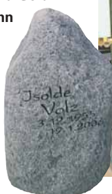
Strahlkabine Futura von der Firma Goldmann

ßem Düsenabstand eingegeben; dies ist notwendig, damit ein weicher und gleichmäßiger Strahl entsteht. Danach erfolgt das Sandstrahlen mit zwölf Übergängen, ohne dass die Folie durch Bürsten berührt wird. Die Strahlluft wird angepresst, damit sehr feine Schriften sauber und V-förmig in die Tiefe geblasen werden können. Auch nach einer Strahlzeit von 20 Minuten ist die Folie noch resistent genug,