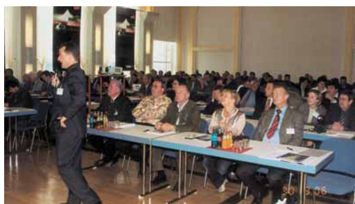
Die Tagung fand große Resonanz.

Dyckerhoff AG Biebricher Straße 69 65203 Wiesbaden Tel.: 06 11/67 60 Fax: 06 11/6 76 10 40 info@dyckerhoff.com www.dyckerhoff.de