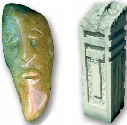
»Der Beschützer«, Speckstein (l.) und »Warten«, Leccestein (r.) von Stephan K. Müller

Kurt Müller GmbH Massenheimer Weg 15 61352 Bad Homburg Tel.: 061 72/43 28 7 Fax: 061 72/43 19 0 mail@kurt-mueller-gmbh.de www.kurt-mueller-gmbh.de