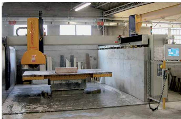
Speedycut FK / NC 800

Breton S.p.A. Via Garibaldi 27 I-31030 Castello di Godegone (TV) Tel.: 00 39/04 23/76 91 Fax: 00 39/04 23/76 96 00 info@breton.it www.breton.it