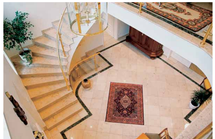
Von der Firma Kurt Müller ausgeführtes Treppenhaus

Über 60.000 qm Lager und Ausstellung. Direktimport, Lager und Vertrieb von exklusiven Natursteinen.