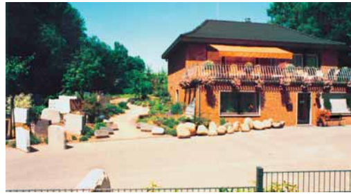
Die Steinbildhauerei Wirtz in Haltern am See