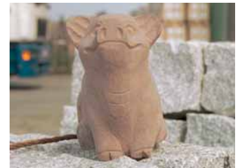
Schwein gehabt: Das Wetter spielte bei beiden Veranstaltungen mit.

MAGNA Westfalia GmbH Industriestr. 14 32602 Vlotho-Exter Tel.: 052 28 / 96 06 - 0 Fax: 052 28 / 96 06 16