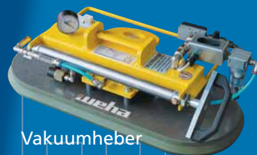
Vakuümheber EP 600

Die Baureihe EP mit Handpumpe: allzeit bereit!