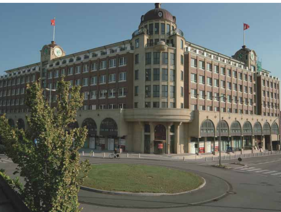
Störtebekerhaus, Süderstrasse 288, 20537 Hamburg, Fertigstellung 2005

In Zusammenarbeit mit den Architekten hat der Bauherr verschiedenste Stile gemixt und hier wirklich Mut bewiesen, sich von gängigen Gestaltungswegen zu trennen. Nicht ein Architekturpreis war das Ziel, sondern ein Gebäude, das gebrauchsfähig, zweckmäßig, nützlich und trotzdem