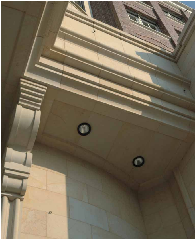
Deckenuntersicht Hauptingang mit Konsole