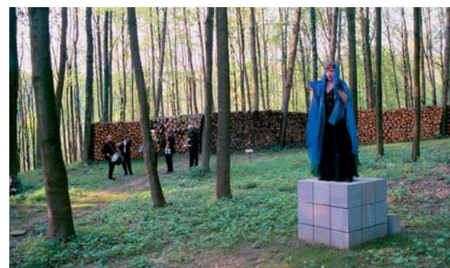
Verschiedene Grab- bzw. Grabmalformen; rechts die Sängerin Birgit Harnisch

native zum Trend des namenlosen Verschwindens«, sagt er. Entstehen soll ein Platz lebendiger Erinnerung, ohne Einheitsgräber, ohne starre Friedhofszeiten und ohne vorgeschriebene Rituale. Roth versteht sich nicht als Bestatter, sondern als Begleiter auf dem Weg der Trauerbewältigung. Menschen, die eine vertraute Person verlieren oder verloren haben, sollen ohne Zeitdruck Abschied nehmen und ganz allmählich zurück ins Leben finden können.