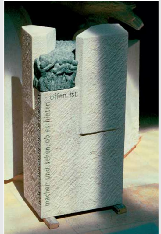
Arbeit von Christian Blank