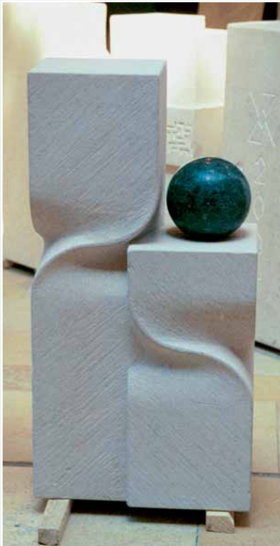
Arbeit von Florian Wagner