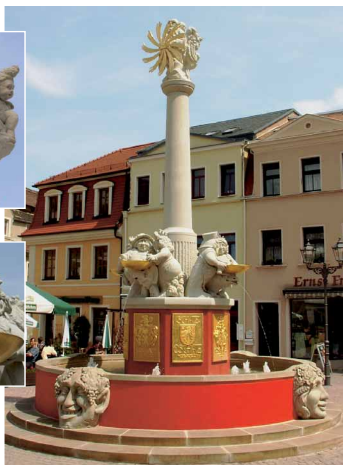
Der neue Altmarktbrunnen in Oschatz